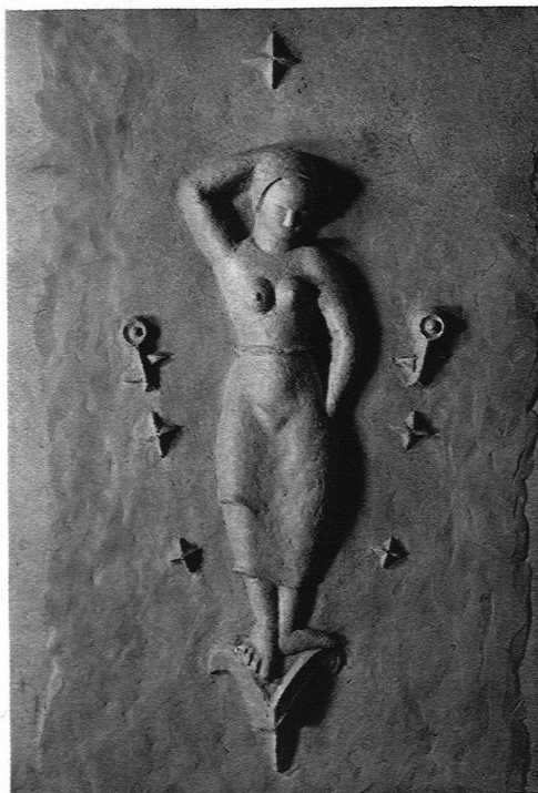
WALTER GYGI Dekorative Figur