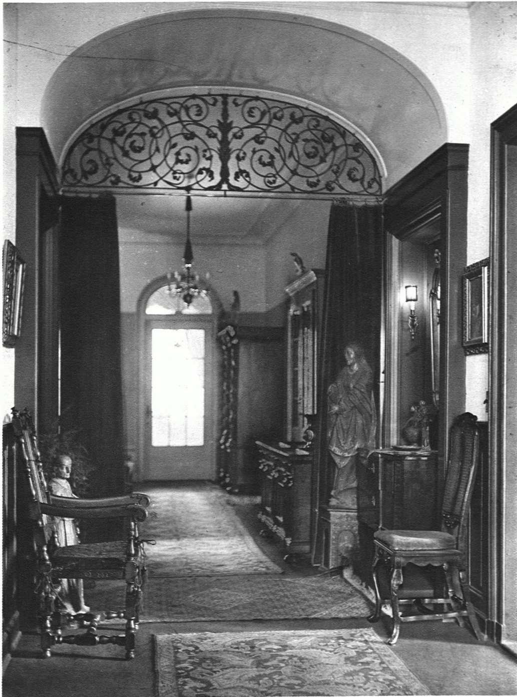
FLUR IN EINEM WOHNHAUS IN ZÜRICH J. KELLER & CIE., MÖBELFABRIK, ZÜRICH