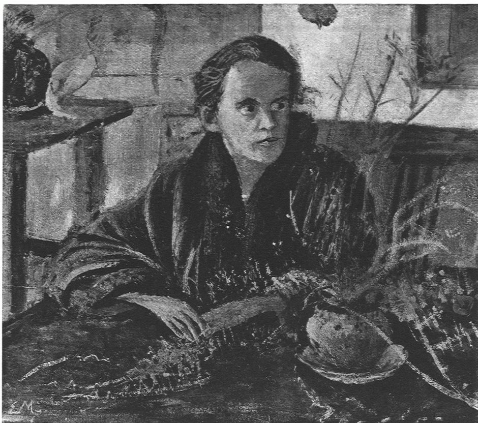
ERNST MORGENTHALER / BILDNIS (1923) Sammlung des Zürcher Kunsthauses