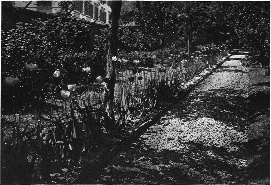
GARTEN SCHWEIZER Blumenweg

dabei dem Gelände künstlerisch über- oder unterordnet, ist eine Frage der jeweiligen Bauaufgabe.