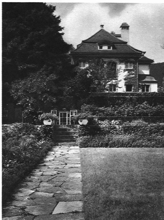
GARTEN SCHWEIZER, GLARUS Plattenweg / Das Wohnhaus vor dem Kriege erbaut durch Architekt Streiff †