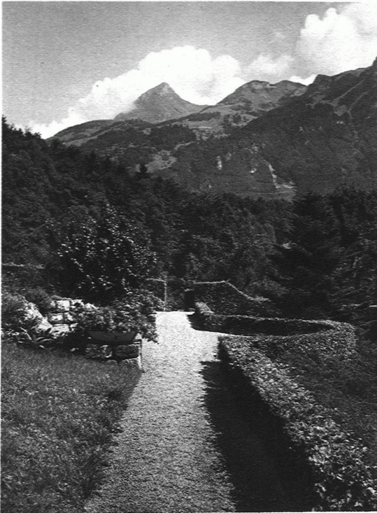
J. SCHWEIZER, GARTENARCHITEKT, GLARUS GARTEN M. IN GLARUS Gesellschaftsplatz mit Trockenmauer