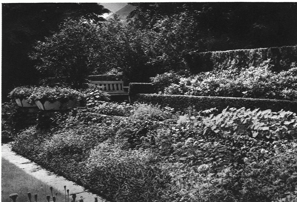
GARTEN SCHWEIZER Sitzplatz in der Südwestecke