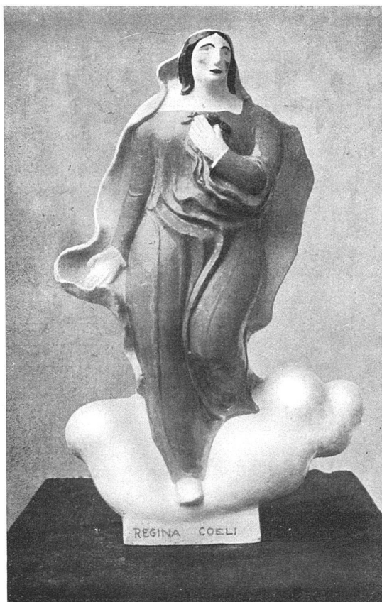
PAUL WILDE, BILDHAUER S. W. B., BASEL Muttergottes-Statue / Wettbewerbs-Entwurf (Die Aufschrift ist wegzudenken)

Ueber unsere eigene Arbeit, die Führung, Ausstattung, Richtung der Zeitschrift, will ich hier nicht reden. Das sei auf einen spätern Zeitpunkt verspart. Wer von Freund und Feind so viel hören muss, wer so oft die ganze Skala vom begeisterten Lob bis zum unwirschesten Tadel, in öffentlichen und privaten Aeusserungen, durchkosten muss, kann ruhig schweigen und die Sache für sich selbst sprechen lassen. Man ahne nicht, meint Scheffler in seinem letzten Essay-Band, wo er u. a. auch über Kunstzeitschriften spricht, wie dicht eine solche Revue von Feinden aller Art umlagert sei. Wir ahnen es, aber auch das wissen wir, wie nahe und dicht die Freunde stehn.