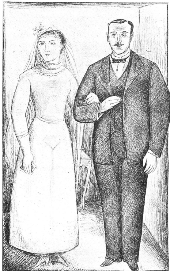
Les Mariés (lithographie)

Si j'ai le goût mauvais, je m'en excuse, mais il va donc, pour les lithographies, à l'anecdote, à l'amusement. Pour n'être pas si délectable, si montée de majesté et de vénusté que la Belle au râteau , la page de Lavaux , où Aubersonois échafaude de scabreuses corniches de vignes au-dessus d'un lac béat, et chargées de leur petit monde