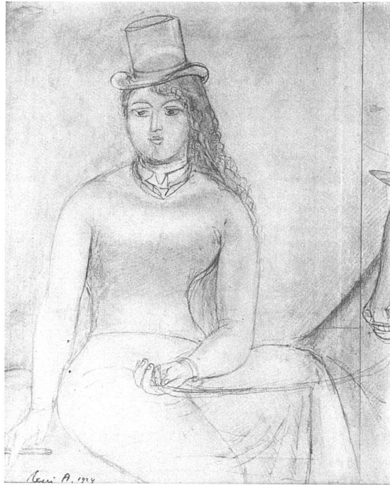
L'Ecuyère (dessin)

Vous apercevez d'abord dans quel rapport ces dessins tiennent au croquis, ils en sont justement l'antipode. Car le croquis cherche à surprendre lestement les particularités du modèle, première passe, premier degré de la connaissance, mais ces dessins en sont le degré dernier. Tout le circuit de la peinture les sépare donc du croquis. Ceci précède le tableau, les dessins le prolongent; ceci est dessous, les dessins dessus. C'est ce qu'il advient d'un objet après toute l'aventure de la peinture courue, à terme de possession, presque à fin d'onde. Croquis dit nerfs, hâte, pression, ces dessins résorption et détente. Voilà, si l'on entend les nuances, ce qui les met à part de l'ordinaire: ils sont des tableaux derrière quoi l'on a retiré la peinture. Plongés dans un acide, dans un révélateur de photographe, sans doute ils y retrouveraient leurs valeurs et leurs tons. La couleur se lit entre les lignes, le tableau est sous-entendu.