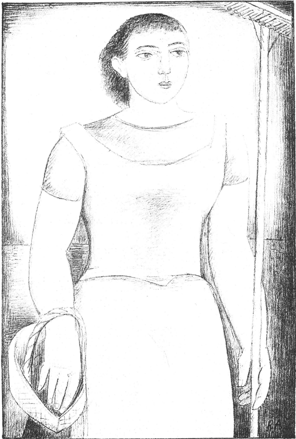
RENÉ AUBERT-JONNOIS La Belle au râteau (lithographie)