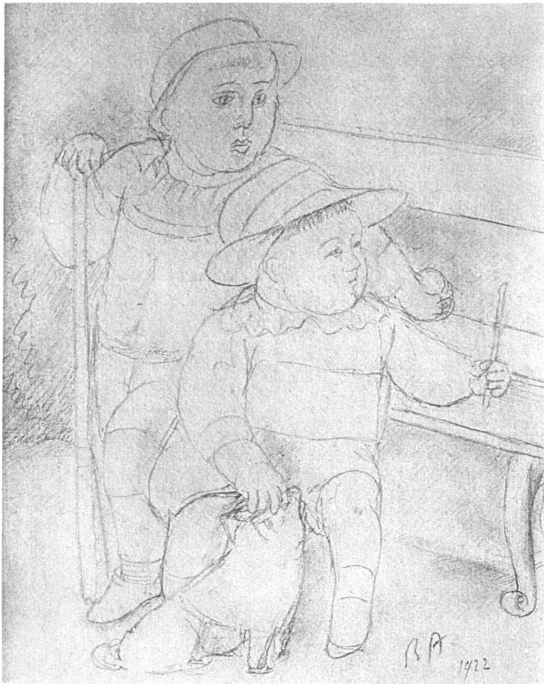
RENÉ AUBERJONOIS Enfants (dessin)

matière. Ombres, hâchures, crayonnages, par quoi d'autres marquent l'effet, la force, l'éclairage, rien n'en reste, ou indiqués d'une si discrète insistance qu'ils se découvrent à la deuxième lecture. On peut dire que ces dessins tendent au blanc. De là leur force: ils ne disent plus rien que l'essentiel. C'est le dernier schéma, la trame sans plus, les fils de la pensée à nu.