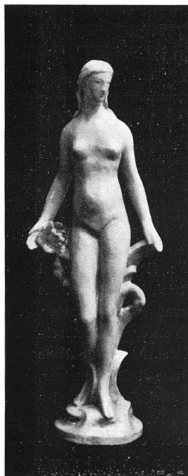
HUNERWADEL, ZÜRICH Faïence, 30 cm

Et si les uns et les autres y parviennent, l'Exposition de céramique suisse aura l'utilité que l'on conteste à presque toutes les expositions. L. Florentin.