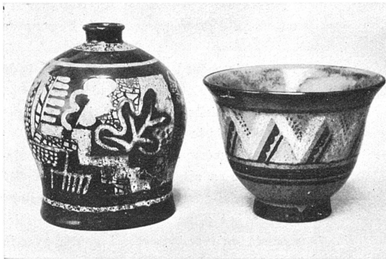
IMBACH-AMANDRUZ Atelier «Menelika» Genève