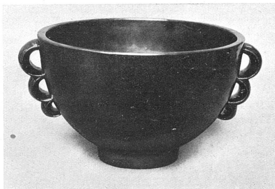
Terre lustrée noire / Grès de grand feu.

Cette science de la matière, cette juste appréciation de ce qu'elle peut donner, un sculpteur de Zurich, Arnold Hünerwadel, nous les montre avec une série de statuettes de faïence où tout ce qu'il y a de souple, de gras, de tendre et de féminin dans la terre émaillée, s'exprime avec un naturel charmant. La technique ici correspond à une sensibilité d'artiste et d'artisan, de sculpteur et de céramiste. Mme Jeanne Perrochet, de la Chaux-de-Fonds, s'en rapproche avec des statuettes blanches en terre réfractaire vernissée, semblable à la terre qu'emploient à Bienne les potiers, plutôt qu'avec des grès flammés qu'ammollit trop leur estampage.