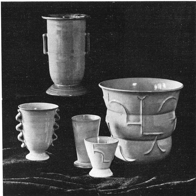
MEISTER ET CIE., DÜBENDORF-STETTBACH Cachepot à relief, Vans, faïence / 1/4 grand. nat.