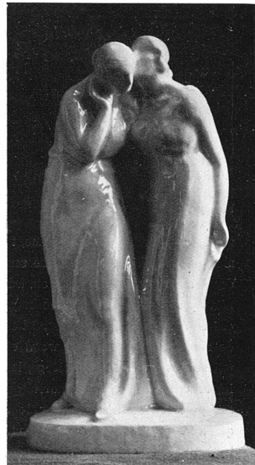
JEANNE PERROCHET, CHAUX-DE-FONDS Grès flammé