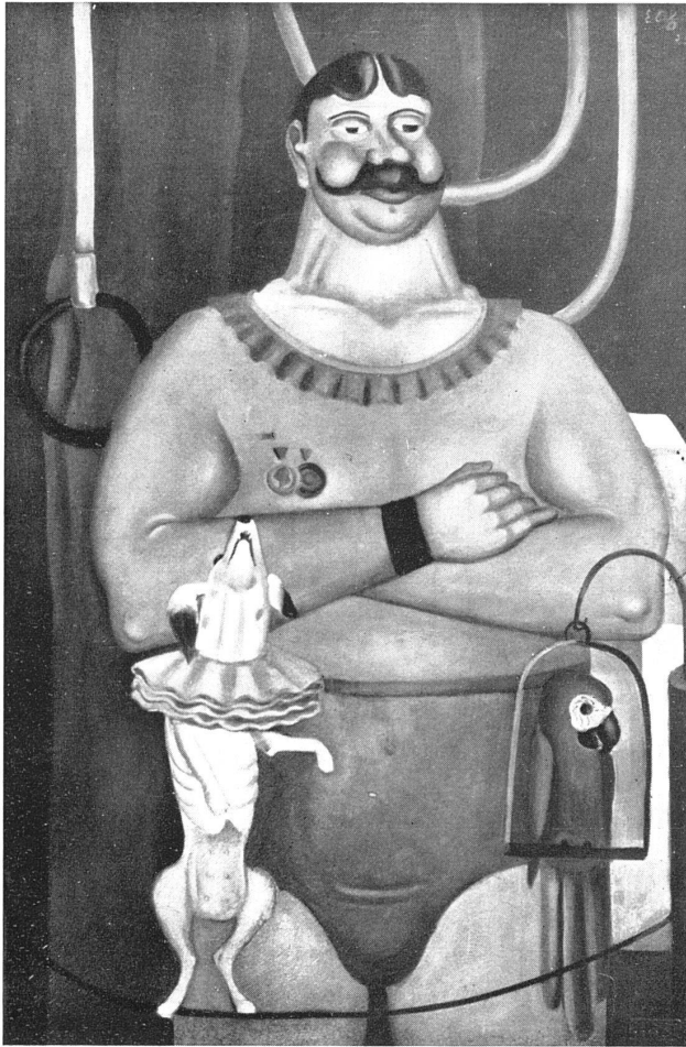
EMANUEL SCHÖTTLI ZIRKUSAKROBAT, 1925

ders wirklich nicht mehr aufbringen, unvollendet ist ja Dein Werk, wir müssen es uns gestehen, ungemalt sind die vielen Ideen, die Dein zurückgelassenes Werk zur Voraussetzung gehabt hätten.