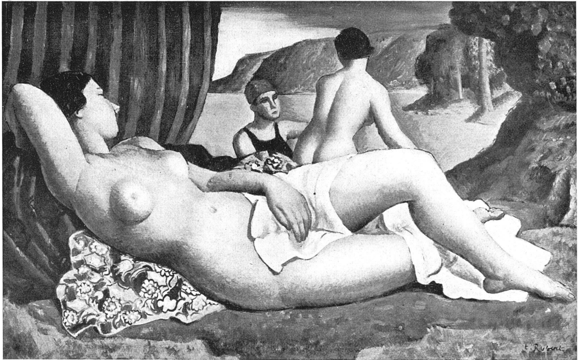
THÉOPHILE ROBERT / »BAIGNEUSE« 1927 1,00 × 0,65 m

d'expression. Ainsi obtient-il l'unité de la tâche créatrice, sans jamais déplacer l'axe de la méditation. Une âpre ferveur sert de soutien à ses compositions.