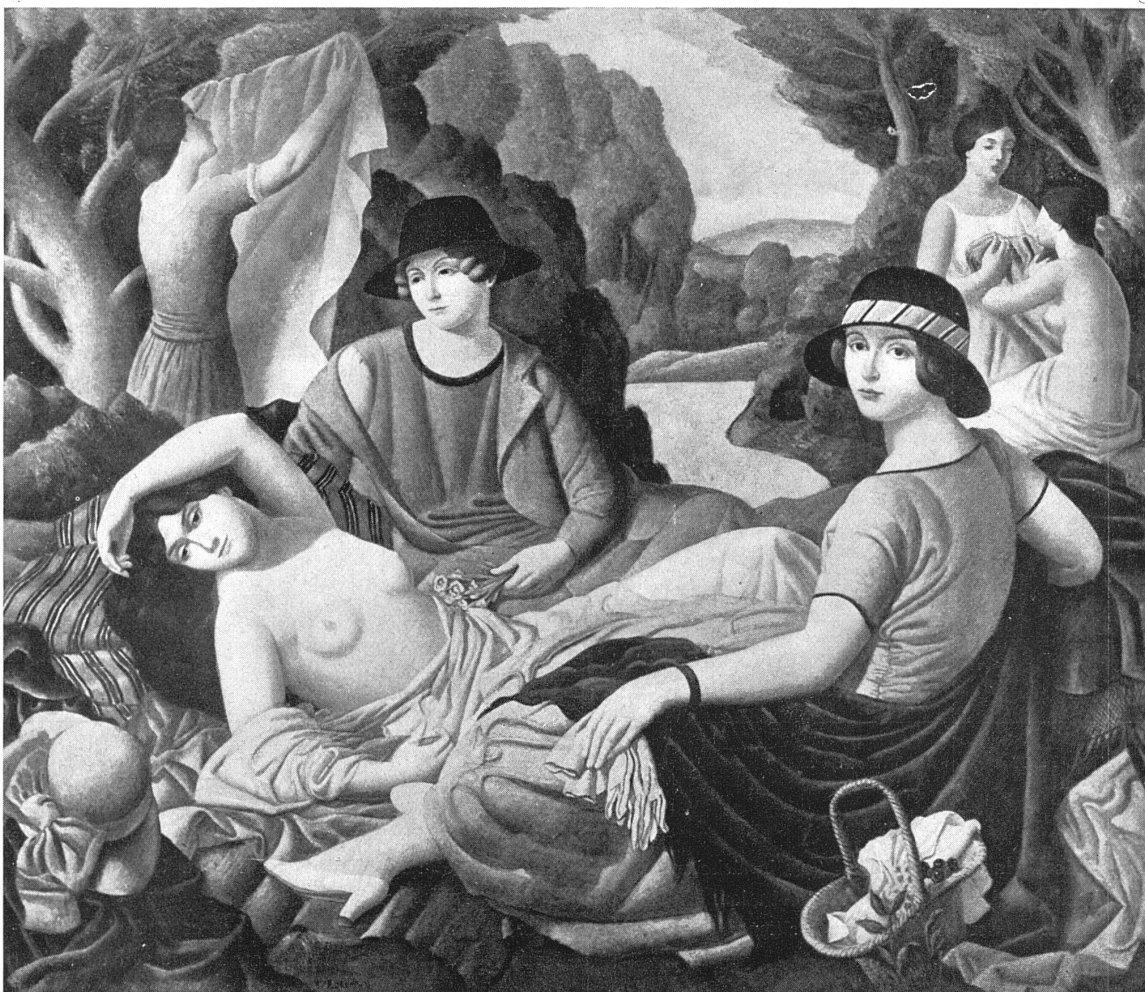
THÉOPHILE ROBERT / »REPOS« Musée de Berne / 1,90 × 1,30 m