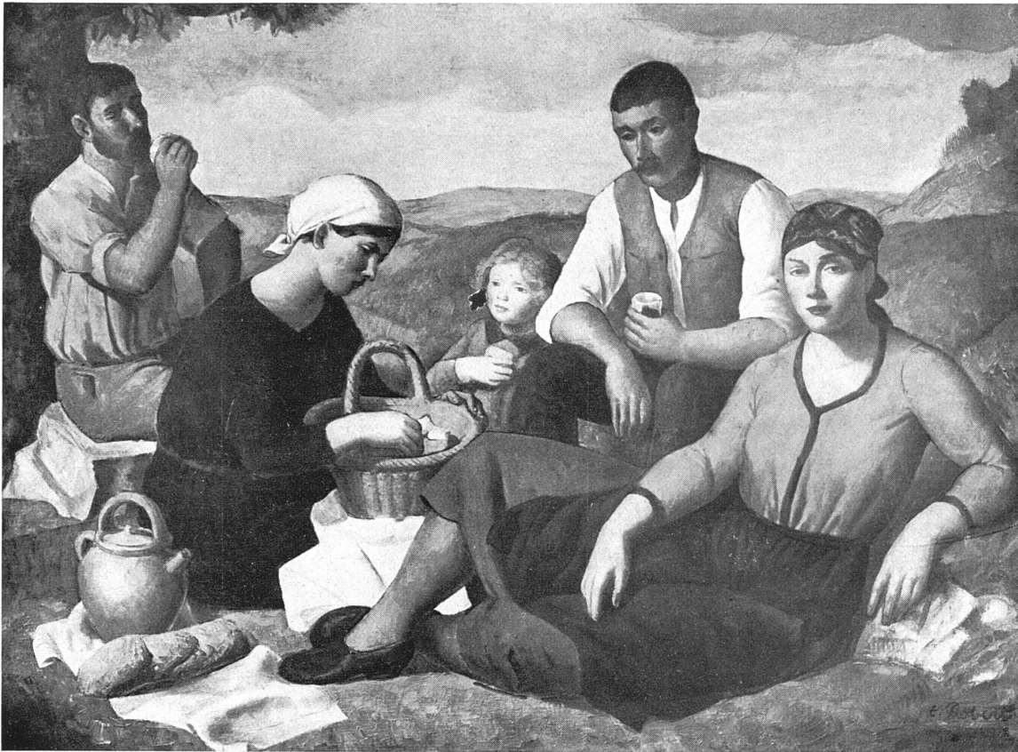
THÉOPHILE ROBERT / »REPAS CHAMPÊTRE« 1,30 x 0,97 m