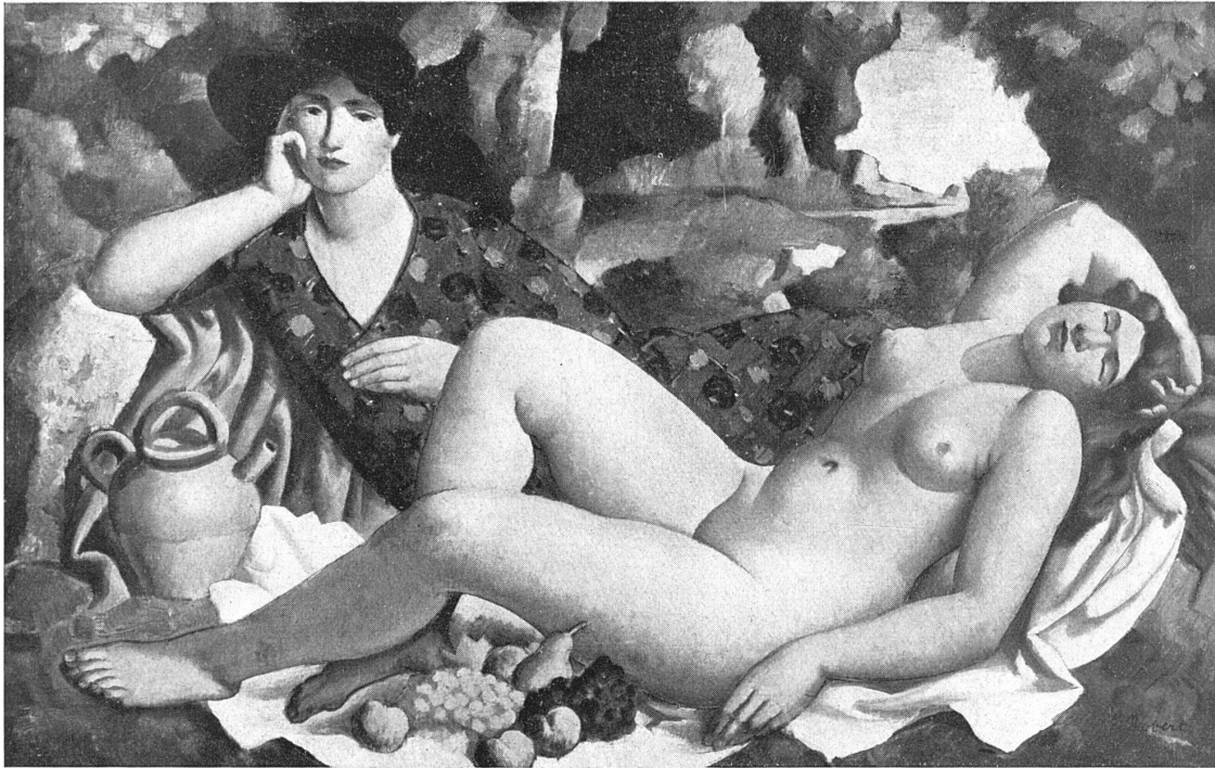
THÉOPHILE ROBERT / »LA DORMEUSE« 1926 Musée du Luxembourg, Paris / 1,00 × 0,65 m