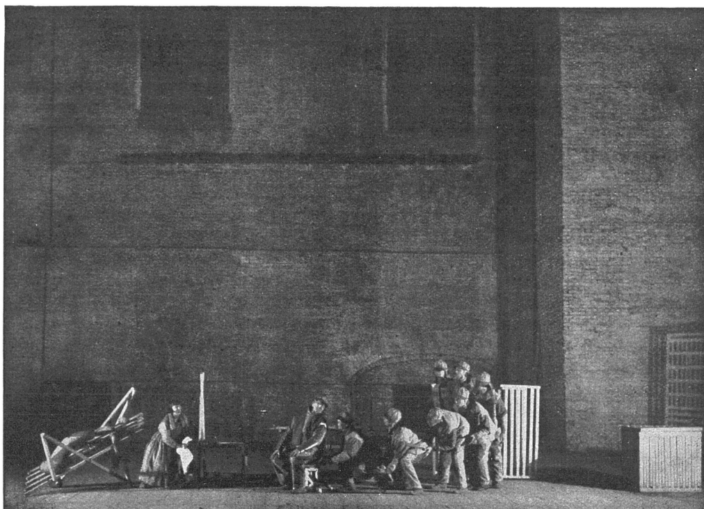
SCENE AUS »TAREKINS TOD« IM MAYERHOLD-THEATER

russischen Intelligenz mit der obligaten Brille, daneben einige Soldaten der Roten Armee in Uniform; dort wieder harret ein alter Bauer mit seinem Weibe der Dinge, die da kommen sollen, beide in schwere Schafspelze gehüllt. Der Mann zieht sich die phantastisch geformte Mütze tief in das Gesicht, die Frau reißt die Augen weit auf, und ihr Mund verrät grenzenloses Staunen, obwohl die Vorstellung noch gar nicht begonnen hat. Auch Chinesen sieht man, Turkestaner, Kirgisen und Tscherkessen, bisweilen hört man lettisch oder finnisch sprechen. Die Logen sind angefüllt mit Mädcheninstituten und kommunistischen Agitationsschulen; fein gekleidete Herren halten sich bescheiden auf den hintersten Plätzen.