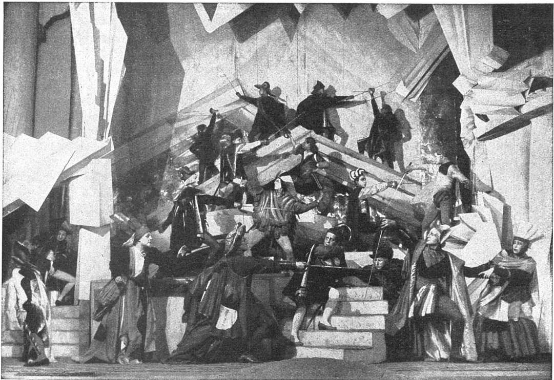
KAMPFSZENE IM MAYERHOLD-THEATER