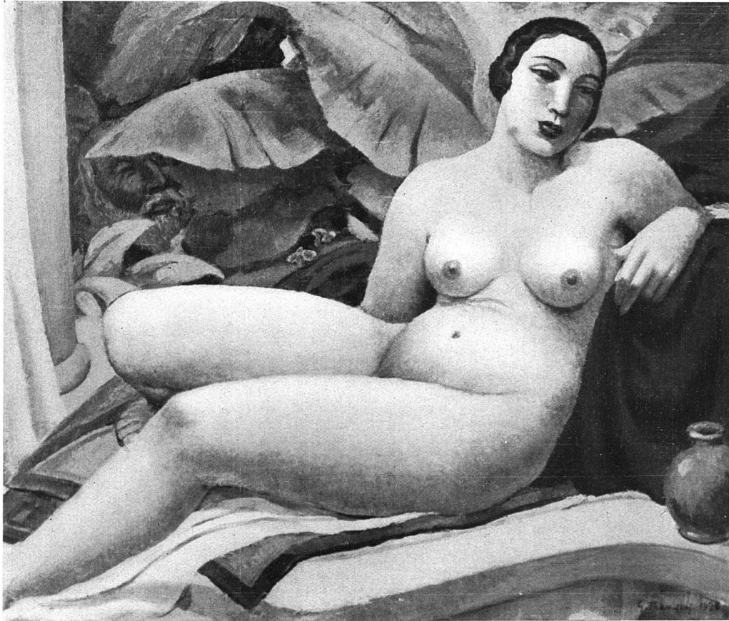
GUSTAVE FRANÇOIS / SUZANNE (HUILE) / VERSION 1928 / 130/110 cm