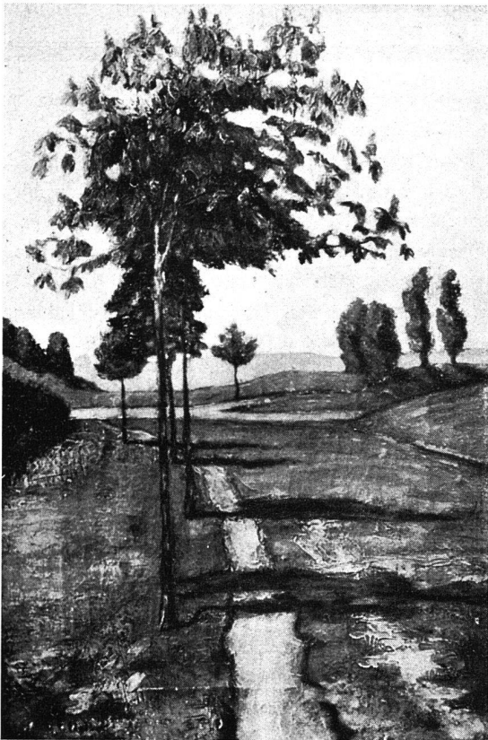
FÄLSCHUNG Gk. 2325 / Abb. 3 (30,3 : 43,7 cm) / Slg. Dosenbach, Zürich

barkeit. Das vorderste Blütenbäumchen zeigt wohl in seinem pastosen, unbeobachteten Farbbrei am fassbarsten die schmierige Mentalität des Falsifikates.