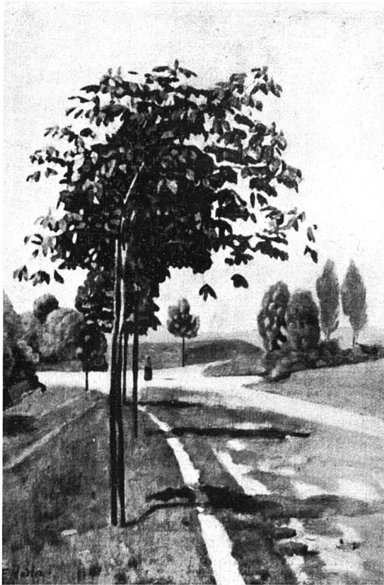
F. HODLER / BLÜHENDES KASTANIENBÄUMCHEN / Abb. 1 Fassung I (44:61 cm), unveröffentlicht