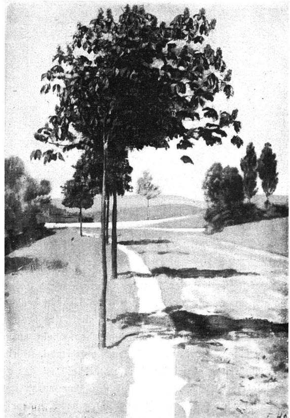
F. HODLER / BLÜHENDES KASTANIENBÄUMCHEN / Abb. 2 Fassung III (44,5:63 cm)