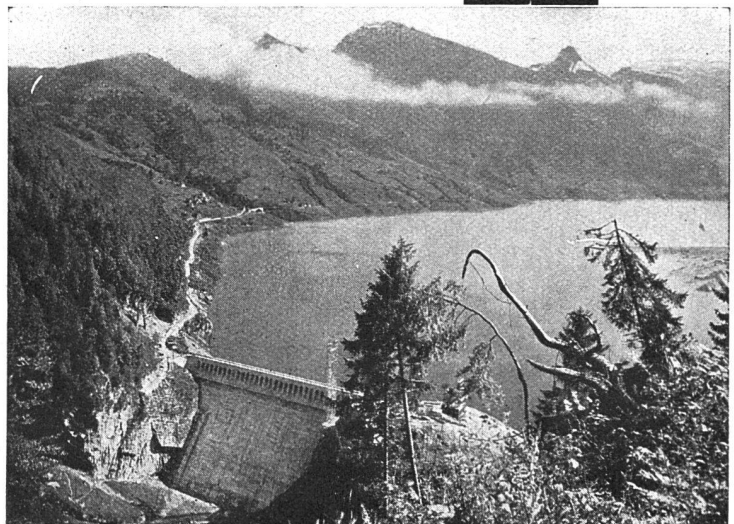
Staumauer im „Schräh“, Wäggethal gemeinsam ausgeführt mit Ed. Züblin & Co. A.G.

Uebernahme schlüsselfertiger Ein- und Mehrfamilienhäuser