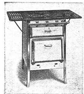
Gasherd Gella mit 3 Kochstellen oder Gellis mit 4 Kochstellen