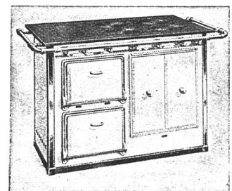
Der moderne Gasherd für Herrschaftsküchen, ausgerüstet mit allen Chikanen