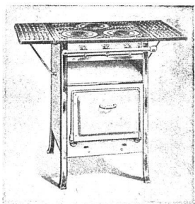
Volksherd mit 3 od. 4 Kochstellen

Sie sind das Vollkommenste, was heute auf diesem Gebiet existiert