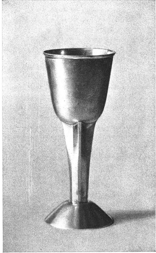
POKAL / ERNEST MUSPER, BERN