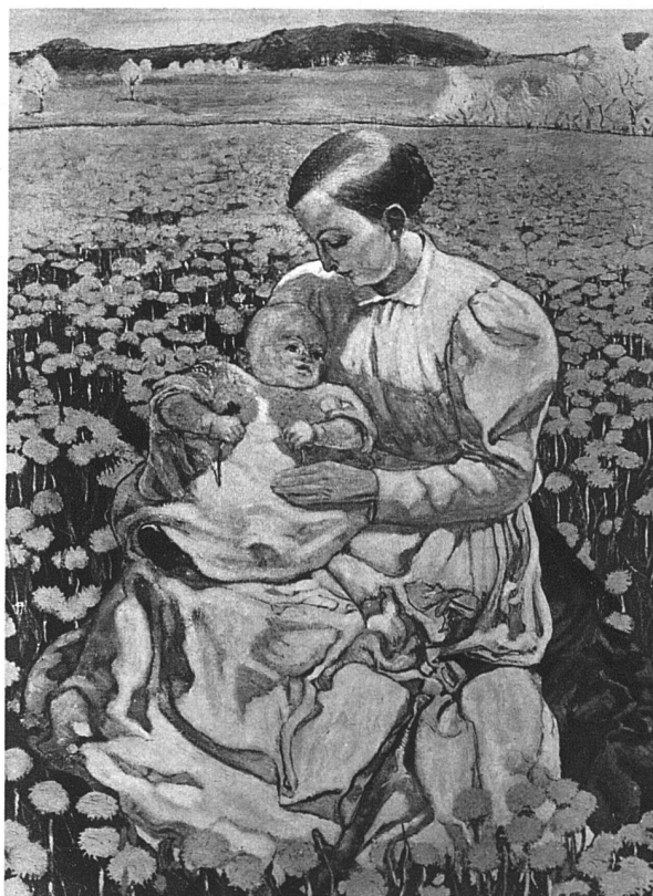
CUNO AMIET / MUTTER UND KIND IN DER LÖWENZAHNWIESE, 1903