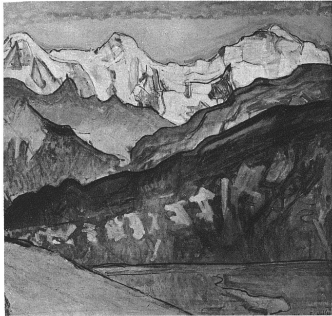
F. HODLER EIGER, MÖNCH, JUNGFRAU

mitteln. Zwar machte er keineswegs an den Landesgrenzen Halt. Von Van Gogh beispielsweise sicherte er sich ein paar erstklassige Stücke, als sie noch ganz billig und überdies zu ihrem und des Käufers Vorteil wirklich authentisch waren. Von Constantin Guys brachte er einen ganzen Blätterwald zusammen, vielleicht weil er Zeit gefunden hatte, Baudelaires herrliche Abhandlung zu lesen, noch eher aber, wer weiss das, weil sein Schützling Amiet sie in Pont-Aven gelesen hatte. Auf der andern Seite waren ihm selbst die Brücke-Leute nicht fremd. Im ganzen erhielt seine Sammlung aber zusehends schweizerische Färbung, und zwar der Haltung wie der Herkunft nach, obwohl neben dem alemannischen der welsche Teil weitgehend berücksichtigt wurde. Das war und ist nur in Ordnung. Wenn jeder sich zuerst in seinen vier Wänden umsehen würde, wäre vielerorten manches besser.