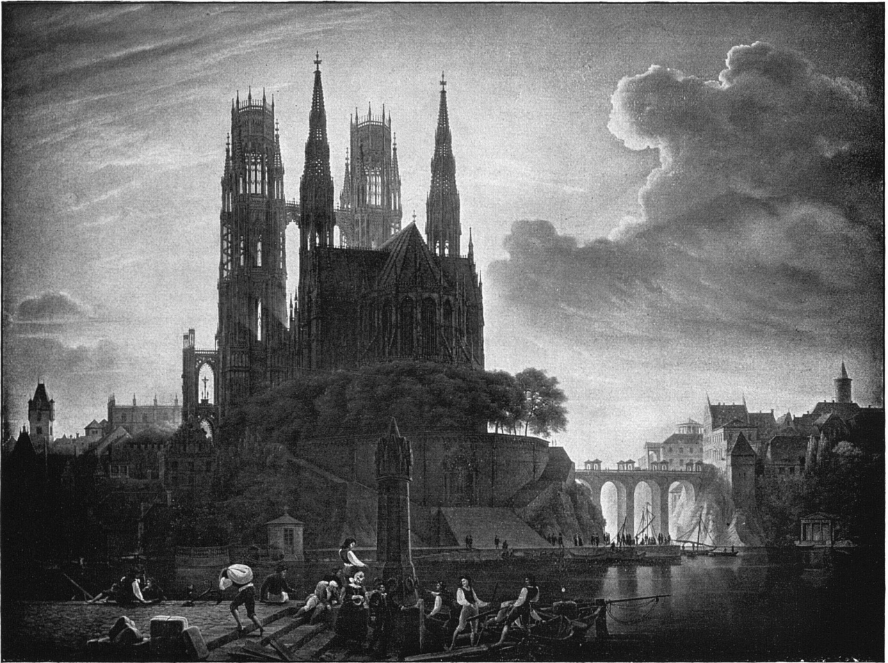
Carl Friedrich Schinkel Mittelalterliche Stadt am Wasser, 1813

Während sich die klassischen und romantischen Strömungen in den architektonischen Arbeiten Schinkels in verschiedenen ungefähr gleichzeitig entstandenen Entwürfen gesondert äussern, treten sie in diesen unter dem Eindruck von Caspar David Friedrichs entstandenen Gemälden vereinigt auf. Klassisch ist die heroische Geste des Ganzen, das «Komplette» der Bauten, die Vollständigkeit und Präzision der Zeichnung, der grandiose Flug der Wolken, die römischen Brückenbögen und die akademisch gestellten Posen der kleinen Figuren im Vordergrund. Klassisch empfunden ist die frontale Freitreppe unter dem Dom und die symmetrische Treppenführung. Das romantische Element liegt vor allem in der Wahl des Stoffes, im neuerwachten Interesse an Gotik und Mittelalter überhaupt und in dem barocken Beleuchtungseffekt der gegen das Licht gesehenen Domsilhouette.