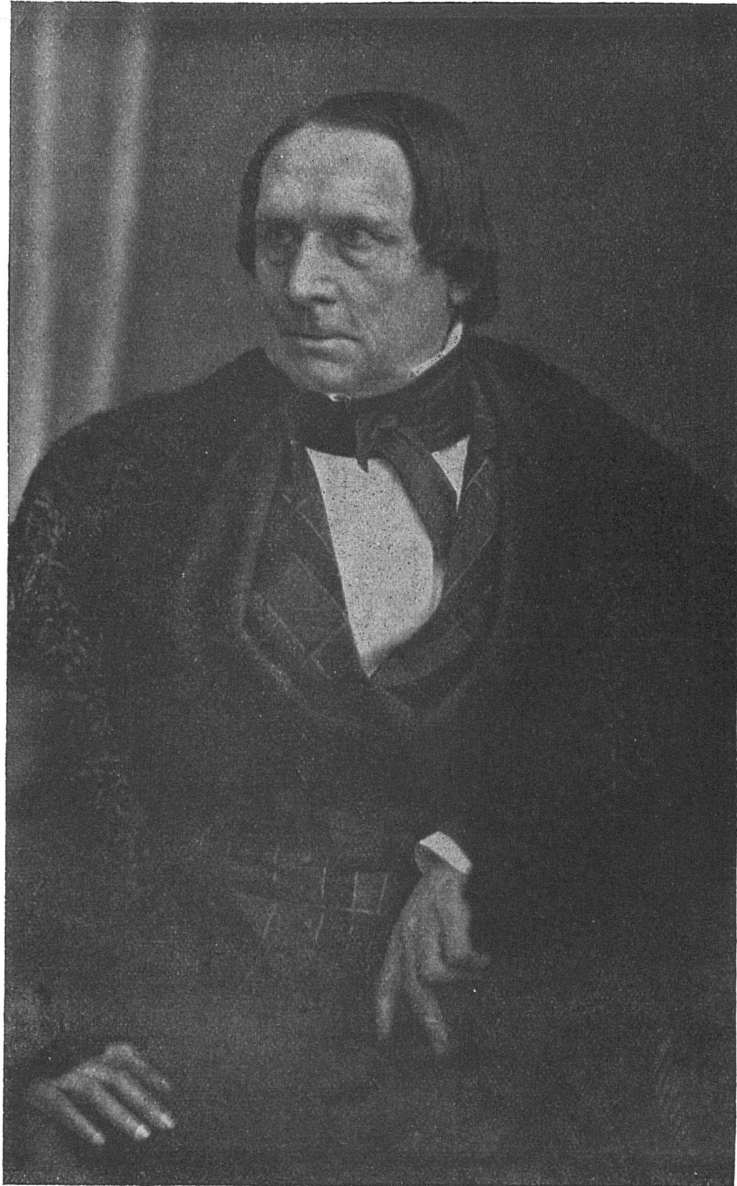
der Maler Peter v. Cornelius 1783—1867