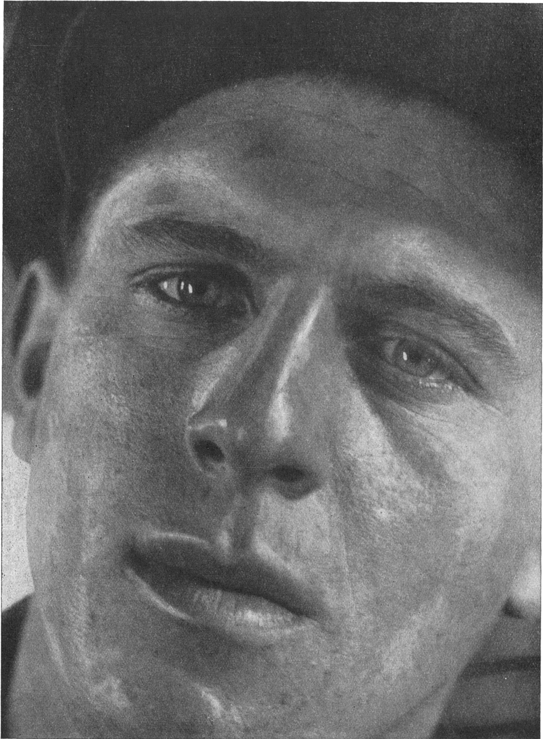
Aus «Köpfe des Alltags» von Helmar Lerski Verlag Hermann Reckendorf, Berlin 1931