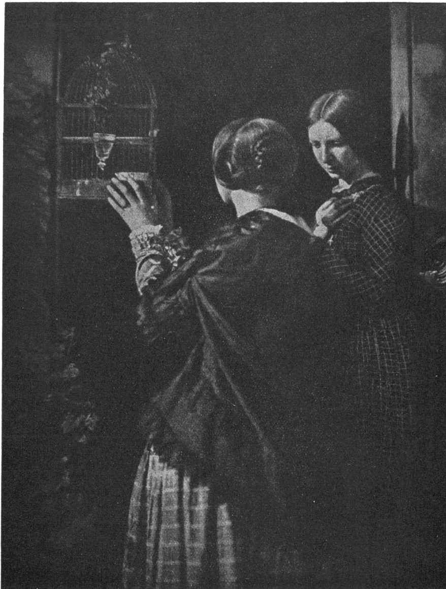
David O. Hill, Phot. Zwei Schwestern

Aus «Der Meister der Photographie David Octavius Hill 1802—1870» von Heinrich Schwarz Insel-Verlag