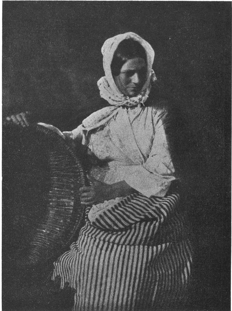
Fischverkäuferin aus Newhaven

Aus «Der Meister der Photographie, David Octavius Hill, 1802—1870» von Heinrich Schwarz Insel-Verlag