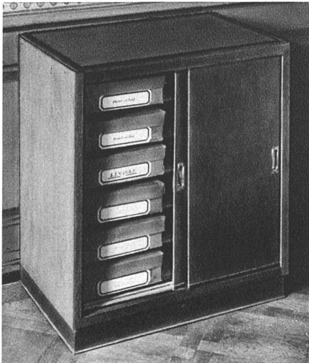
Kombinierbares Schiebetürkästchen für Kartotheken oder Hefte. Erle hellbraun gebeizt und mattiert. Blatt dunkelgrauges Linoleum