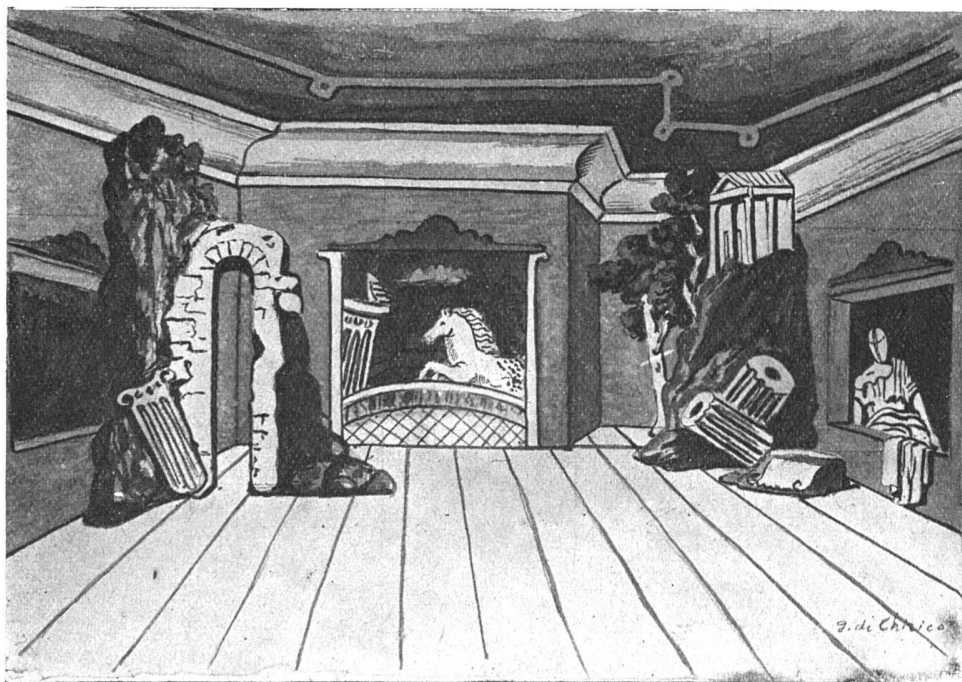
Giorgio de Chirico: «Le Bal» (1929). Sammlung Serge Lifar.