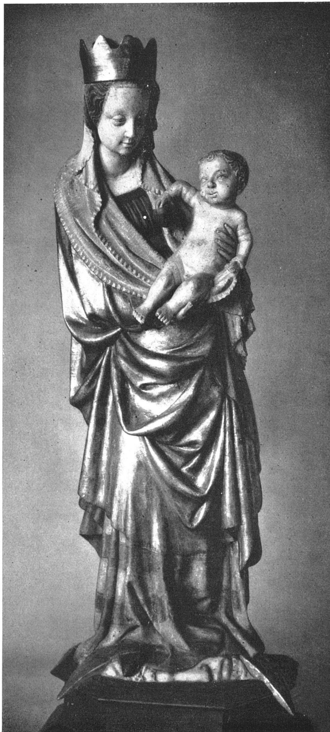
Die Muttergottes aus der Alpkapelle von Leiggenen oberhalb Ausserberg (Wallis), 116 cm hoch, Mittelfigur eines Baldachinaltars, ursprünglich wohl aus der Pfarrkirche von Raron, jetzt Landesmuseum Zürich. Entstehungszeit 1400–1440 von einem schwäbischen (wahrscheinlich Ulmer) Meister, mittelrheinisch beeinflusst.

gleichgeordnet mit dem schwäbischen Klettgau, Allgäu und a. m. im Verbands des Konstanzer Sprengels. So ist es durchaus kein Zufall, dass sich eine Anzahl wichtiger deutschschweizerischer Bildwerke als Ab-