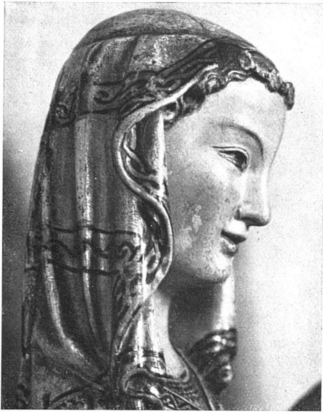
oben: Die Madonna der Heimsuchungsgruppe von St. Katharinenthal bei Diessenhofen, im Profil