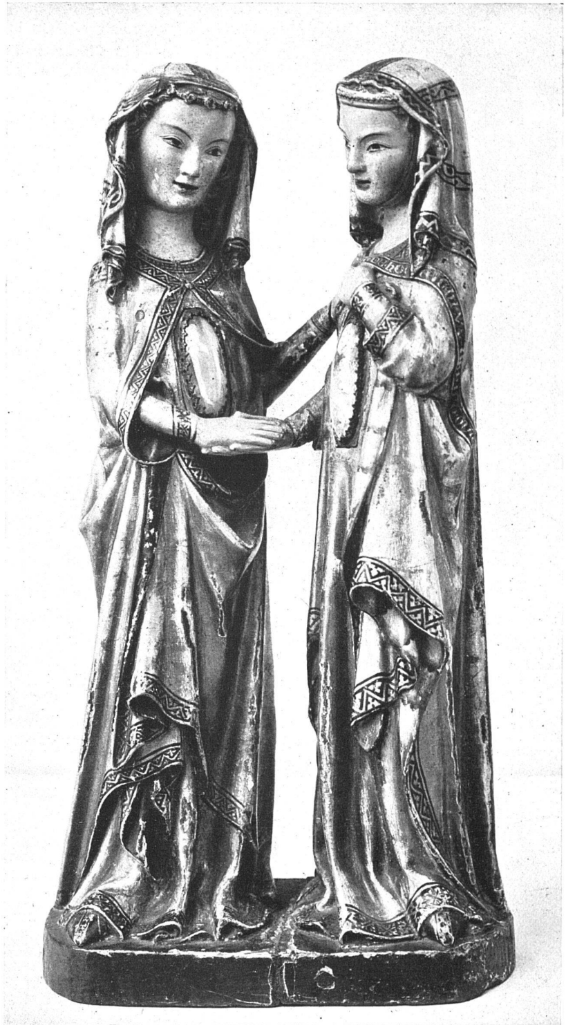
Heimsuchungsgruppe, 59 cm hoch, aus dem Dominikanerinnenkloster St. Katharinental bei Diessenhofen, bald nach 1300, jetzt Metropolitan-Museum New-York

verbleiben. So erklärt sich der häufig weite Strecken überspannende Stilzusammenhang der Monumentalplastik und ihr vorwiegend stammesmäßig bestimmtes Gesicht (dem meist noch eine Dosis fremder Züge aus dem Kontakt mit anderer Art beigemischt sind), so andererseits die gesteigerte lokale Einfärbung der Holzschnitzerwerkstatt.»