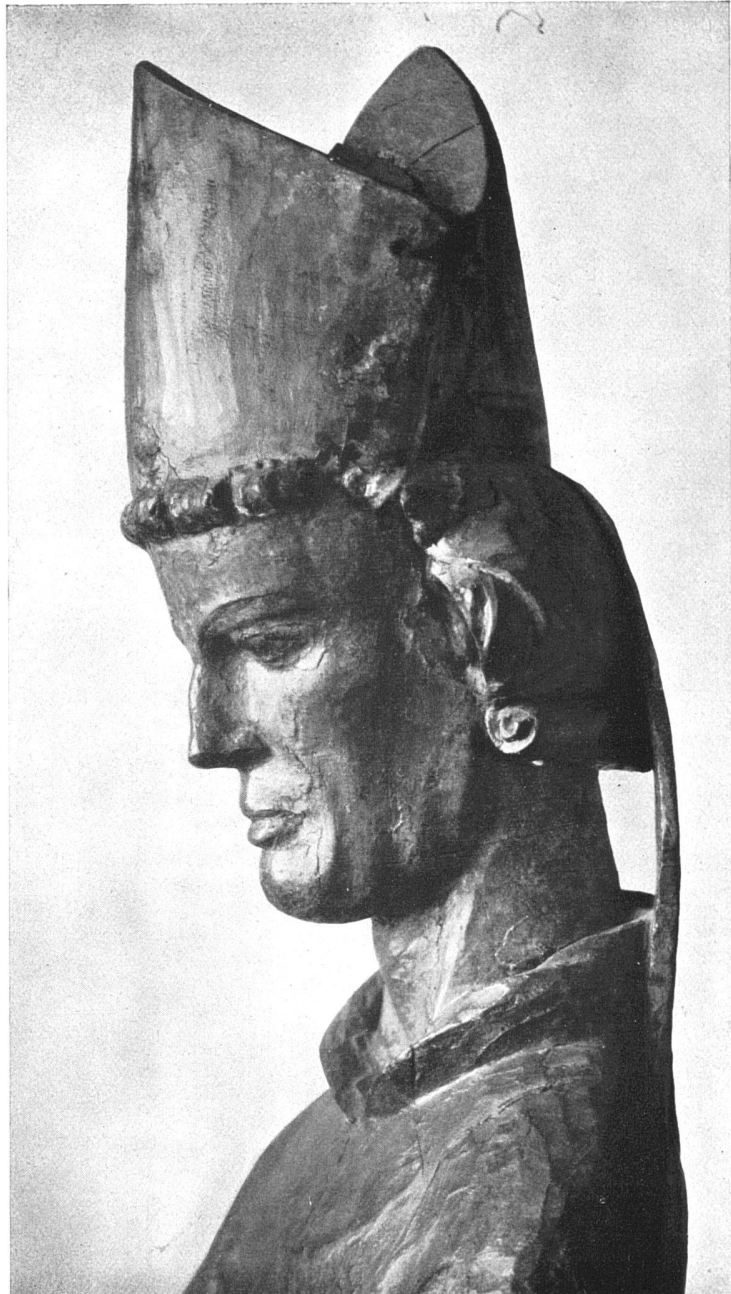
Kopf eines thronenden Bischofs aus Adetwil (Luzern) 142 cm hoch Landesmuseum Zürich etwa 1300–1330

Alle Abbildungen aus: Gotische Bildwerke der deutschen Schweiz 1220–1440 von Ilse Futterer , Quart, 206 Seiten Text, 96 Tafeln mit 313 Abb. Dr. Benno Filser Verlag, Augsburg 1930. Geb. Fr. 48.75.