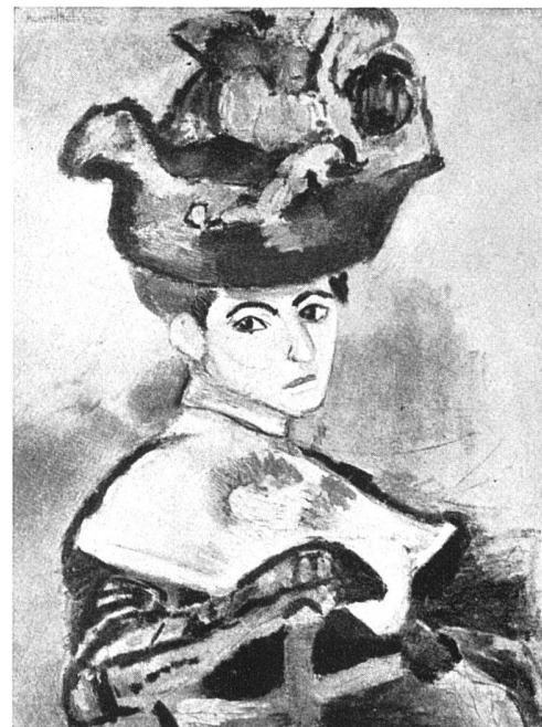
Henri-Matisse Femme au chapeau, 1905