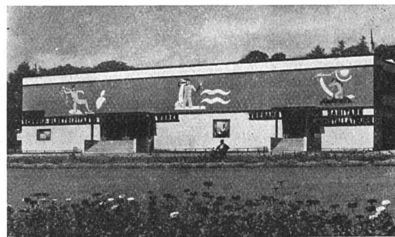
Ausstellungshalle des Vereins der Schweiz. Elektrizitätswerke Otto Ingold, Arch. BSA, Bern. Im Fries aller Bauten auf dem Viererfeld Reklamemalereien verschiedener Berner Künstler