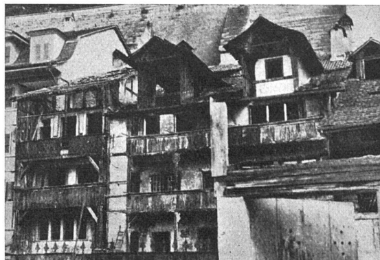
Die Badgasse am Fuss der Berner Münsterterrasse vor der Sanierung

Im Gewerbemuseum wurde am 17. Oktober eine schweizerische Theaterkunst-Ausstellung eröffnet. Sie umfasst eine kleine historische Abteilung und gibt dann einen Ueberblick über den gegenwärtigen Stand der Theaterkunst in der Schweiz. Dass es sich dabei nicht durchwegs um bahnbrechende Arbei-