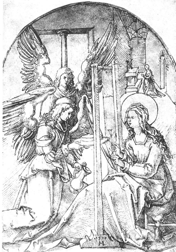
Maria am Spinnrocken, Federzeichnung, 1510, London 280 × 198 mm

Auch die Wissenschaft tat eifrig mit. Kunstwerke besonders wilden Charakters, die man nicht zu lokalisieren vermochte, wurden gerne als «schweizerisch» etikettiert, und weil die Kunst des Hans Leu, der vor 400 Jahren in den Religionskriegen gefallen ist, nicht zu diesem Klischee passt, hat man sie vergessen. Er hat wenig von der neuerwachten Begeisterung für die alten Schweizer Künstler profitiert; sein Name ist kaum je aus einem ungewissen Halbdunkel hervorgetreten. Auch dieses Jubiläum geht still vorüber, während man seine Zeitgenossen Urs Graf und Niklaus Manuel mit schönen Gedenkausstellungen ehrte.