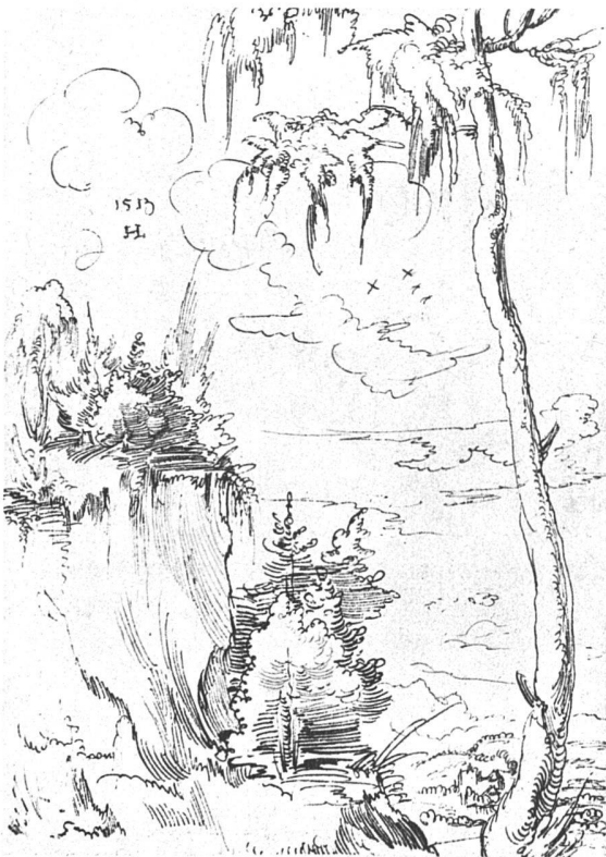
Landschaft, Federzeichnung, 1513 Kunsthau Zürich, 185 × 132 mm

Es gibt ein Klischee von alter Schweizer Kunst: Landsknechte in zerschlitzten Gewändern, keckem Federbarett, mit drohenden Waffen, abenteuerlich und wild, oder prahlerische Wappen mit schildhaltenden Frauen in üppiger Marketenderinnentracht. Diese einseitige Vorstellung von der Kunst unserer Vorfahren, die wahrlich eine ganz andere Breite und Tiefe hatte und zartere Reize zu bieten vermag, ist schuld an viel ärgerlichem Umfug. Man berauschte sich an solchen Repräsentanten einer heroischen Vergangenheit, und so entstand während der Herrschaft des Jugendstils die Mode des Patriotisch-Altertümlichen: man baute Häuser wie Burgen und bemalte Fassaden mit fahnenschwingenden Helden. Man sprach von der Wiedergeburt einer nationalen Kunst, und selbst Hodler hat dieser Gesinnung seinen Tribut nicht entziehen können.