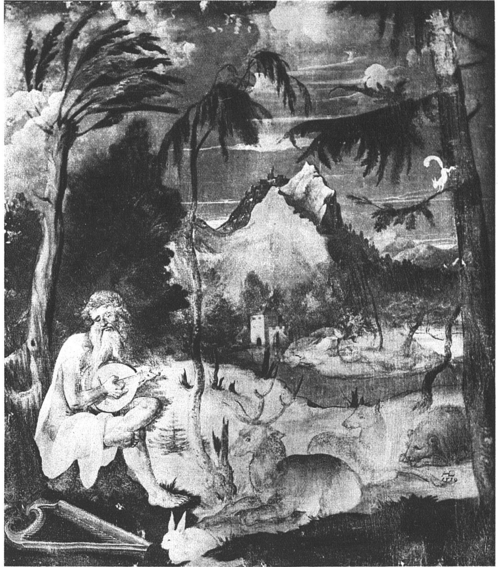
Orpheus mit den Tieren, Gemälde, 1519, Basel, 58×51 cm

glücklicher und freier als in den wenigen «reinen» Landschaften. In ihnen lebt sich der beste Teil seiner sonst immer zurückgedrängten Begabung aus. Alte Legenden und Märchen werden neu erzählt. Der heilige Georg, zum Beispiel, gepanzert zu Pferde im Kampf mit dem Drachen. Aber der Walplatz ist nicht mehr wie in der Legende eine kahle Schädelstätte, sondern ein Märchenwald, dessen riesige Bäume voll moosbärtiger Aeste hangen. Oder die heilige Familie auf der Rast am Waldrand, wo sich der Blick ins Alpenvorland auftut, eine friedliche Idylle, zart und rein empfunden und zum Ausdruck gebracht, wie sonst selten etwas bei uns in jenen erregten Zeitläufen. Einmal wenigstens (wenn anderes dieser Art nicht der Zeit zum Opfer gefallen oder verschollen ist) hat sich Leu auch im Bilde so frei aussprechen können, in einer Darstellung des Orpheus, der durch das Spiel seiner Töne die Tiere des Waldes im Frieden um sich bannt. Verwunderlich hängt das kostbare Dokument einer neu aufsteigenden Welt einsam zwischen den Heilighafeln und Bildnissen. Klein, in die Ecke gedrängt, sitzt der bärtige Musikant auf einem Strunk, ganz seinem Spiel hingegeben, das Hirsch, Hase, Reh und Löwe gleicherweise betört, so dass sie nicht an Verfolgung denken. Die ganze Natur nimmt diese friedliche Melodie auf und steigert sie ins Unwirkliche.