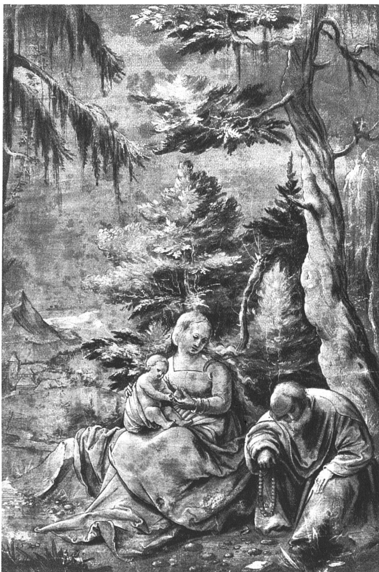
Ruhe auf der Flucht nach Aegypten, Feder, weiss gehöht auf violettem Grund 1520, Sammlung Königs, Haarlem, 299 × 200 mm

Eine zarte Leinwand, die erste vielleicht, auf die in unseren Landen gemalt wurde, dünn, stellenweise zerrieben, stellenweise unvollendet und doch eines der unvergesslichsten Kunstwerke, das je in unseren Grenzen geschaffen wurde. Um dieses kindlich reinen, kindlich ungeschickten und kindlich bezaubernden Werkes willen schon kann man seinen Schöpfer neben den mehr zeitillustrierenden Kollegen nicht übersehen. Weil die besten Leistungen des Hans Leu einfach, stark und selbständig empfunden und gestaltet sind, bleiben sie gegenwärtig, bilden sie noch jetzt ein Entzücken und dürfen wir auch an dieser Stelle, wo kein Anlass zu lediglich antiquarischen Jubiläen ist, ihres Urhebers gedenken.