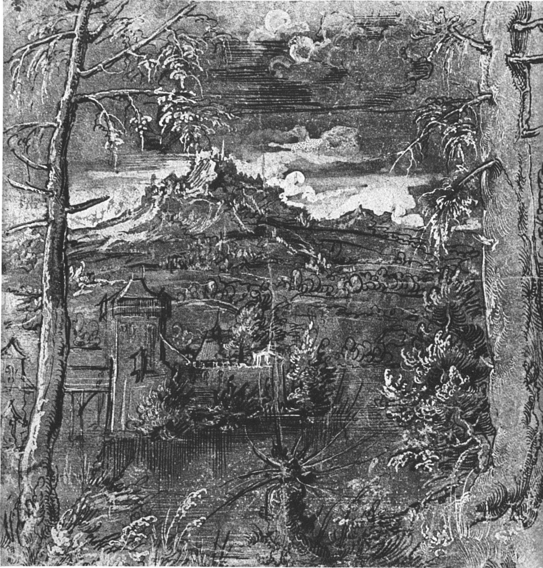
Landschaft, Feder, weiss gehöht auf grünlichem Grund, um 1521, Basel, 277 × 212 mm

ihre Blüte erreichenden deutschen Malerei berührt worden. Da er den empfangenen Anregungen im konventionellen Altarbild nur wenig Ausdruck zu geben vermochte, hat er das Neue, das er zu sagen hatte, mit schönem Erfolg im kleinen Format bildhaft niedergelegt. Er hat gerne und viel gezeichnet, nicht nur, wie man es auch bei uns schon vor ihm kannte, auf Bestellung für den Glasmaler und den Holzschneider, sondern aus Freude am Zeichnen, am Motiv, ganz so, wie wir es seitdem gewohnt sind, so dass wir uns der Bedeutung dieses grundlegenden Umschwunges im Verhältnis des Menschen zur Welt kaum mehr bewusst sind. Wie werden seine Kollegen gespottet haben über solch brotloses, spielerisches Tun! Aber mit diesem Einbezug der Landschaft in den Kreis des künstlerisch Darstellenswerten, der bisher im wesentlichen nur den Menschen umschloss, war der Weg frei gemacht für eine Entwicklung, die ihren Abschluss heute noch nicht gefunden hat. Figuren hat Leu nicht gerne gezeichnet. Mit zagen, lockeren Strichen stehen sie unsicher da, wenn immer möglich eingebettet in eine der frühlingfrischen Landschaften, wie sie damals aufkamen. Da erst, bei Baum und Gras, Fels und Wald, See und Wolken entfaltet sich das freundliche Talent des Meisters, da erst lebt sich die ganze beschwingte Zeichenfreudigkeit jener glücklichen Jahrzehnte reich und überströmend aus. Mit farbigen Papieren und Tuschen wird die Bildwirkung erhöht. Leu ist nie