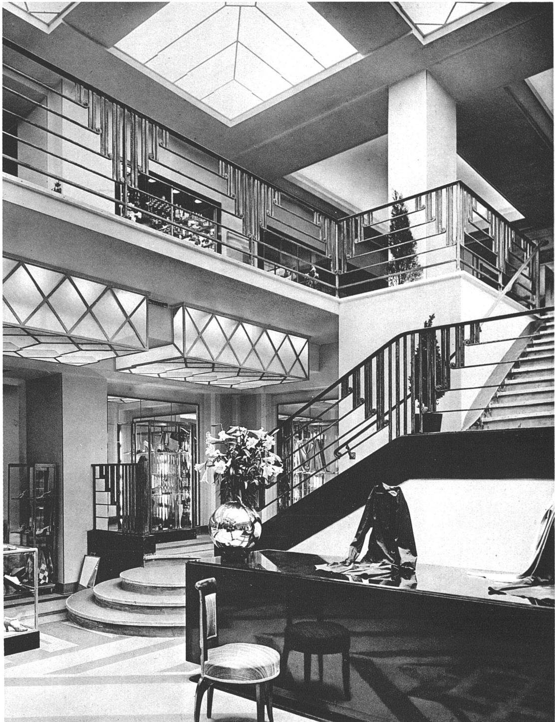
Damen-Modegeschäft Robert Lely, Bld. Haussman, Paris Architekt P. Patout, Paris Wände helllocker, Decke Mattglas und Metall, Fussbodenbelag aus Gummi, hell- und dunkelbeige Verkaufstisch in schwarzem Schleiflack mit Glasplatten