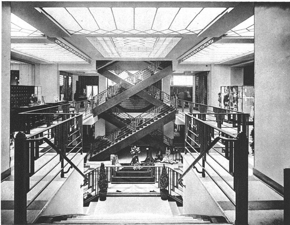
Schaufenster und Verkaufsraum des Damen-Modegeschäftes Robert Lely am Blvd. Haussman, Paris Architekt P. Patout, Paris Schaufenster in Metall gefasst, Abschlussleisten und Sockel aus weissem, schwarzgeädertem Marmor; breiter Rahmen aus Mattglasplatten mit Marmoreinfassung oben und seitlich Namenkartusche Metall und Mattglas, von innen beleuchtet