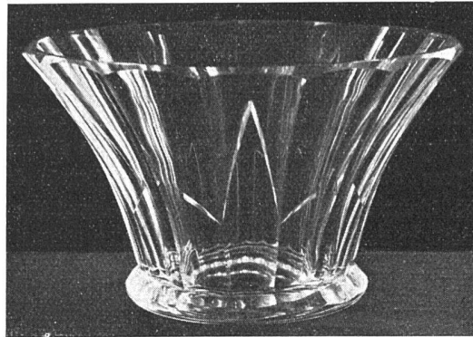
A. Metelák, geschnittene Kristallschale und getönte Vase und Schale von der Ausstellung «Böhmisches Glas»

im Sinne einer Erneuerung. Schliesslich wurden ganz neue Gegenstände hergestellt, witzige Glasfigürchen, Bijouteriewaren und Gebrauchsgegenstände.