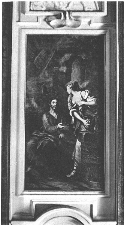
Panneau (Christus und die Samariterin) von Domenico Pozzi, 1784

pathetischen Gebärde, mit der Differenzierung des Ausdrucks, der gross angelegten Gewandung, vor allem aber mit dem um den Kreuzesstamm gehenden Bewegungszug eine bedeutende Gruppe. Sie vereinigt sich mit der volkstümlicheren Schnitzkunst. Der Gekreuzigte, in Holz geschnitzt, gilt als spanische Arbeit; sicher ist nur, dass das Werk 1689 in Como abgeholt wurde, wo allerdings unter spanischer Herrschaft vereinzelt auch spanische Kunstwerke Eingang gefunden haben. Wie Barberini Figürliches zu dekorativen Zwecken verwendet, zeigt die Einfassung der Nische: von den vollen schweren Gestalten der Comasker Heiligen Firmus und Defendens