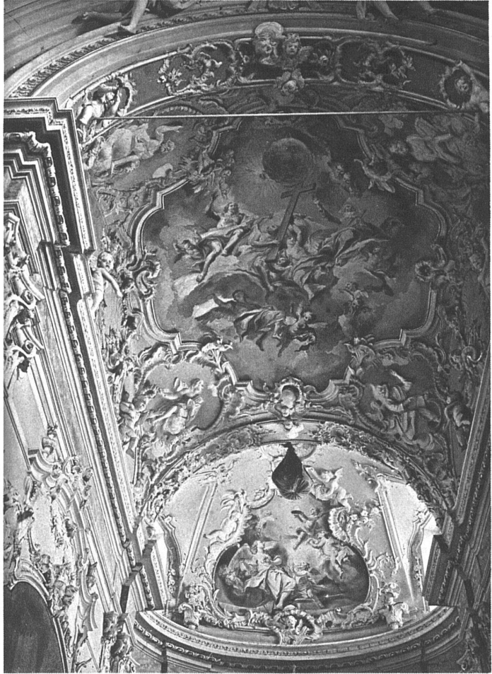
Castel San Pietro, Tessin Pfarrkirche Chorwölbung von Francesco Pozzi, 1759

Restaurierung. In einem spätern Aufsatz soll hier von einigen mustergültigen Renovationen gehandelt werden; es soll aber auch von den viel zahlreichern Gegenbeispiele