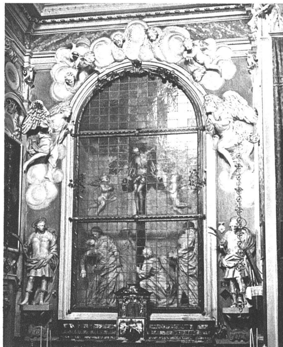
Kreuzigungsgruppe von Giovanni Battista Barberini, 1689