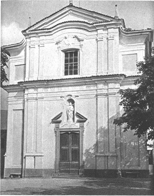
Castel San Pietro, Tessin Pfarrkirche, Fassade

betontem Gegensatz der asymmetrische Rokokoschnörkel zugelassen, in der Rahmung des Apsisbildes; aber selbst jetzt kann es der doch deutsch beeinflusste Tessiner nicht vermeiden, mit vegetabilen und figürlichen Motiven das Gewoge zu mildern. Es sind damit tiefere Gegensätze angetönt, welche die Kunst des südlichen Alpenrandes zu überbrücken sucht: Der Italiener baut, ordnet, arrangiert, wo der Deutsche in freierer Phantasietätigkeit die Formen wachsen, wuchern, emporwogen und empor-sprühen lässt. Die Chorfresken stehen Carlo Carlone aus Scaria im Intelvital (1686—1775) in Komposition und Einzelgestalten ganz nahe. Sicher stammen von dem pinselsicheren, in Süddeutschland, Oesterreich, Italien als Fresko- und Altarmaler gesuchten Carlone die beiden grossen Oelbilder an den Chorwänden mit Szenen aus dem Leben des Titelheiligen der Pfarrkirche, St. Eusebius. Mit ihrer routinierten Komposition, der Abnahme von den reichen Farben und gleissenden Lichtern des Vordergrundes zur flau und blass wirkenden Ferne sind sie typische und wichtige Leistungen des alternden Meisters, der in Como seinen Lebensabend verbrachte.