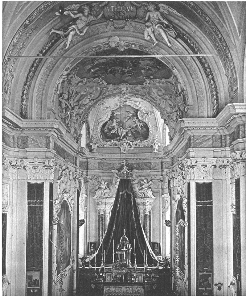
Castel San Pietro, Tessin Pfarrkirche Chor von Francesco Pozzi, 1759

stantinopel, Portugal nicht erfasst, und auch im Tessin harrt noch manches Werk der Entdeckung. Das Kernproblem aber einer Tessiner Kunstgeschichte ist, die Beziehungen hin und her, die Wechselwirkungen zwischen Fremde und Heimat aufzusuchen und darzustellen. Für wie manchen grossen Meister liessen sich die Anfänge im Tessin finden, für wie viele andere entscheidende Stufen ihrer Entwicklung festlegen, und wie viele Werke wären noch den alternden, nicht mehr dem allgemeinen Wanderzug folgenden Meistern zuzuschreiben.