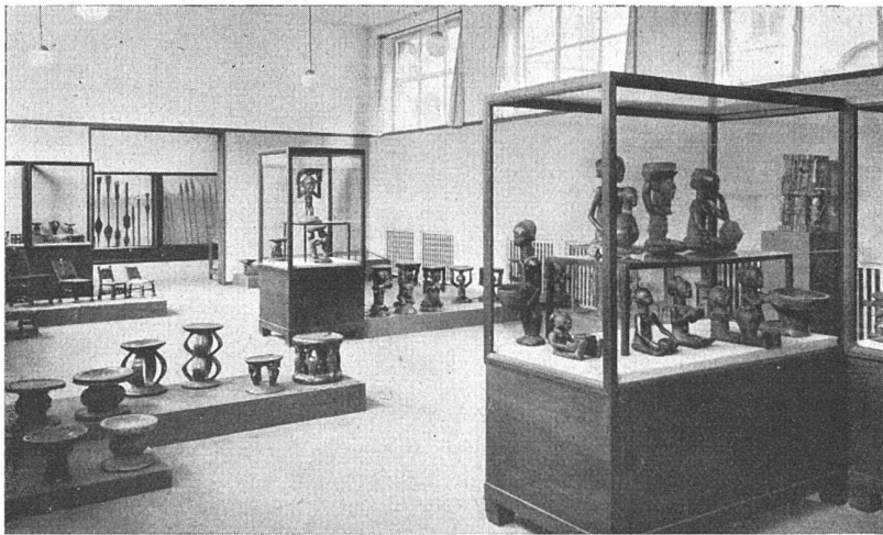
Basel, Gewerbemuseum Negerkunst der Sammlung Coray (Ascona)