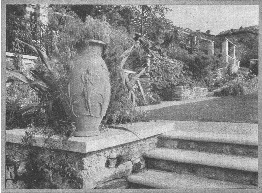
FROEBEL / ZÜRICH 7