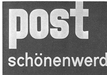
Postschild, Versuch, nicht zur Ausführung bestimmt