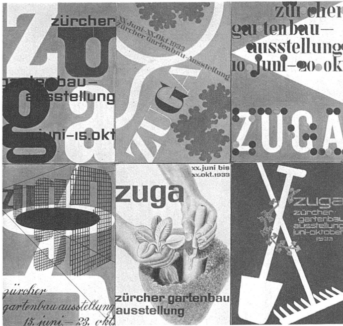
Plakatentwürfe für die Zürcher Gartenbauausstellung 1933