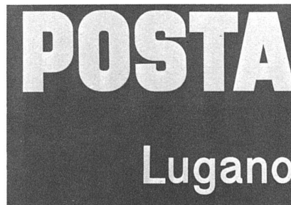
Postschilder, zwei Ausführungsentwürfe