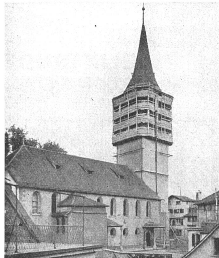
rechts: Kirche St. Peter Zürich

Vertreter in allen grösseren Kantonen • Mietweise Erstellung für Neu- und Umbauten durch