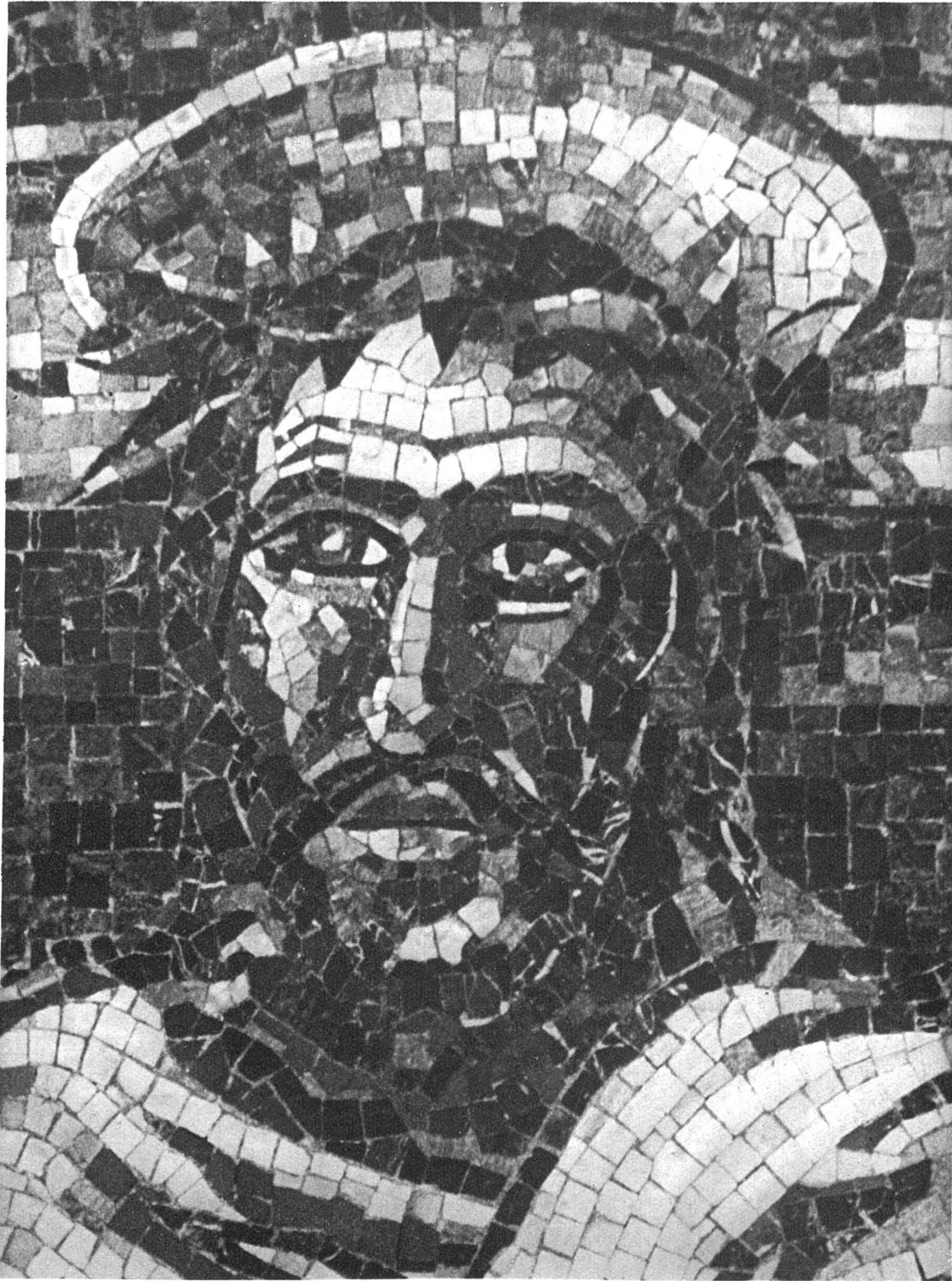
Marcel Poncet, Genève-Paris Mosaïque de marbre dans le tympan du portail de l'église catholique de Gstaad (Oberland Bernois) Détail: Tête de Christ