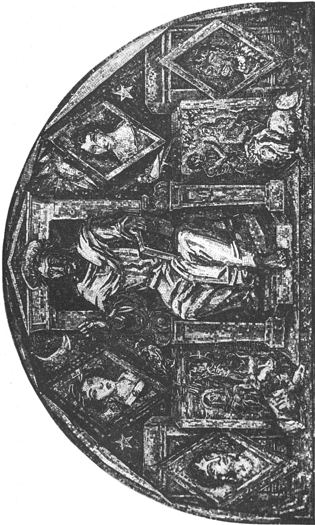
Marcel Poncet, Genf-Paris Marmormosaik im Portalbogen der katholischen Kirche von Gstaad (Berner Oberland)