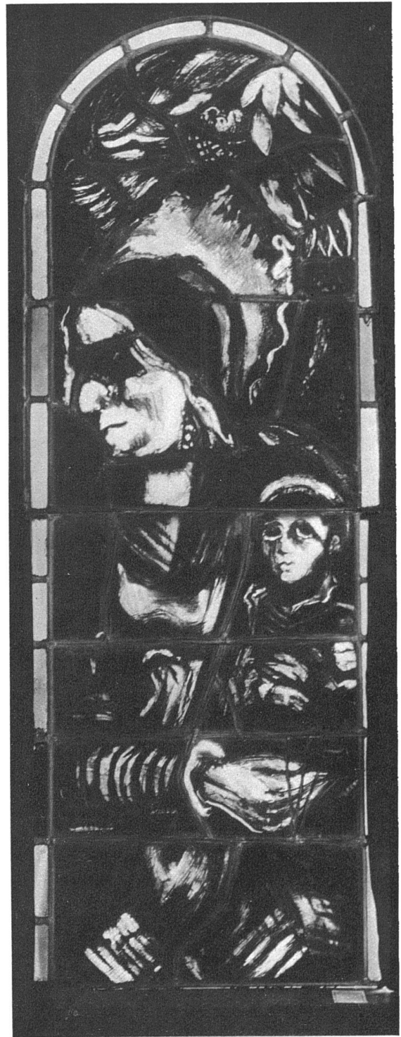
Marcel Poncet, Genf-Paris Einzelheiten aus den Fenstern der katholischen Kirche von Gstaad Détails des vitraux