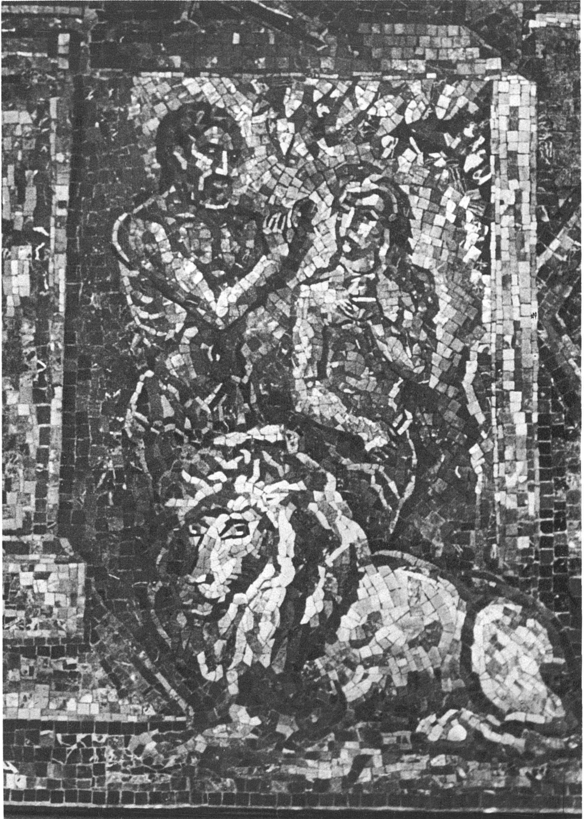
Marcel Poncet, Genf-Paris Marmormosaik im Portalbogen der katholischen Kirche von Gstaad (Berner Oberland) Adam und Eva, Ausschnitt