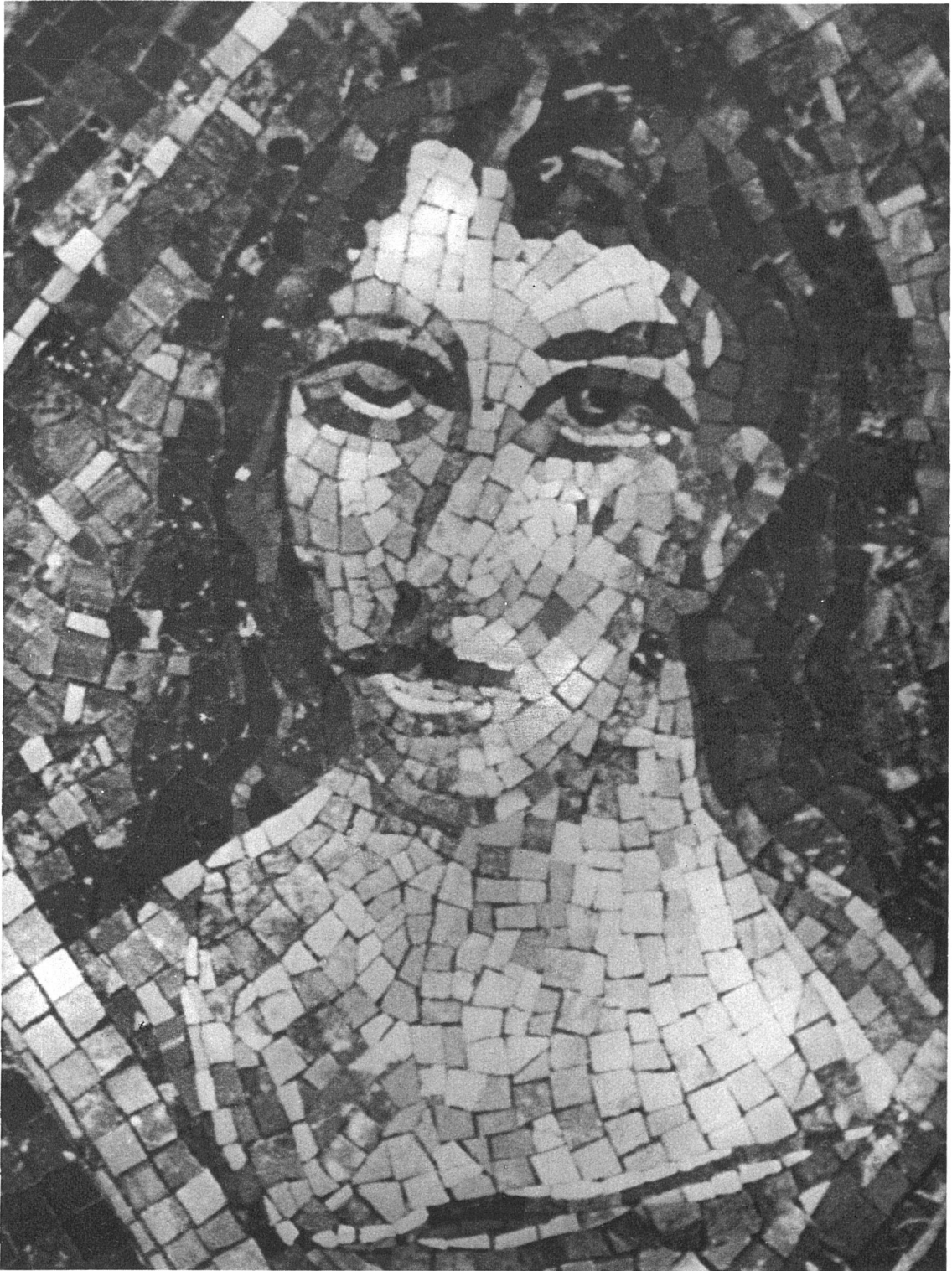
Marcel Poncet, Genève-Paris Mosaïque de marbre dans le tympan du portail de l'église catholique de Gstaad (Oberland Bernois) Détail: La race blanche