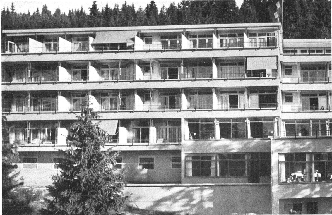
Sanatorium Bella Lui in Montana (Kt. Wallis) Ansicht von Süden Architekten A. Itten BSA, Thun, und R. und F. Steiger BSA, Zürich

Gestalten erscheinen überlang und in die hohen schmalen spaltartigen Fensteröffnungen wie eingezwängt, ein fast qualvoller Anblick. Alle haben in ihrer Körperlichkeit etwas Verzerktes, durch heftigen zuckenden Wechsel der über sie hingehenden Töne noch gesteigert. Man kann sich in dem Kirchenraum von Gespenstern, von Schemen leidender, dulddender Büsser umgeben wähen, die noch mitten in ihrer Pein grell vor uns ins Licht treten, bedrückend für den empfänglichen Beschauer, unsäglich kontrastierend mit dem süßlichen Statuenkitsch auf den Altären, aber unausweichlich packend vielleicht auch für manchen unter dem sportfrohen, leichtblütigen internationalen Besucherpublikum, der sich plötzlich zwischen diese Doppelreihe versetzt sieht. Jedenfalls hat der Künstler eingestandenermassen den Gegensatz des stillen bescheidenen Heiligtums zu dem mit Hotelpalästen übersäten Sportzentrum stark empfunden und auszudrücken gewünscht.