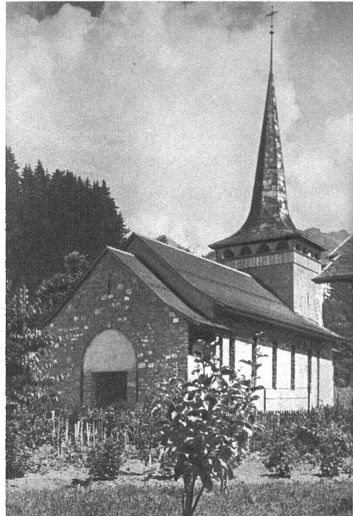
Katholische Kirche von Gstaad (Berner Oberland) Der Portalbogen vor Ausführung des Mosaiks