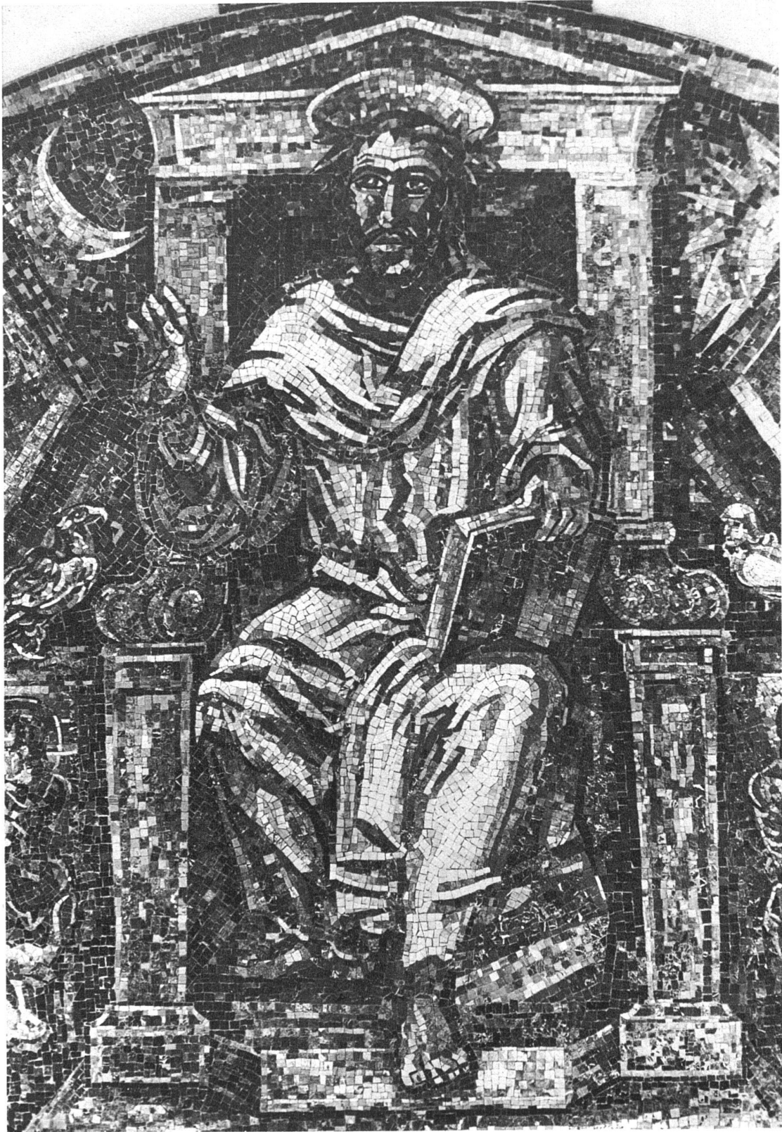
Marcel Poncet, Genève-Paris Mosaïque de marbre dans le tympan du portail de l'église catholique de Gstaad (Oberland Bernois) Détail: Le Christ en majesté