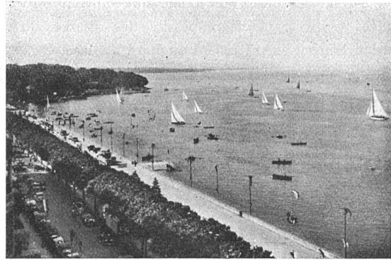
Genève: Le quai Wilson et le Parc Mon Repos