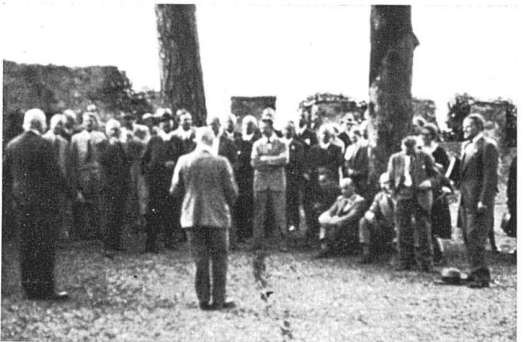
La séance continue à Gruyères, mais elle finira bientôt