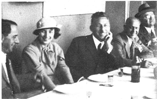
Le goûter à Chardonne, dimanche matin