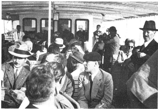
Après la séance du samedi, on se promène en bateau sur le lac