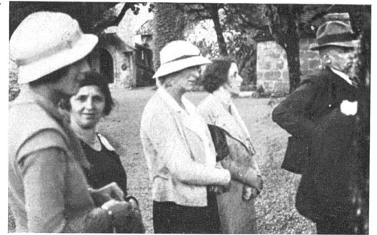
Sur les remparts du Château de Gruyères