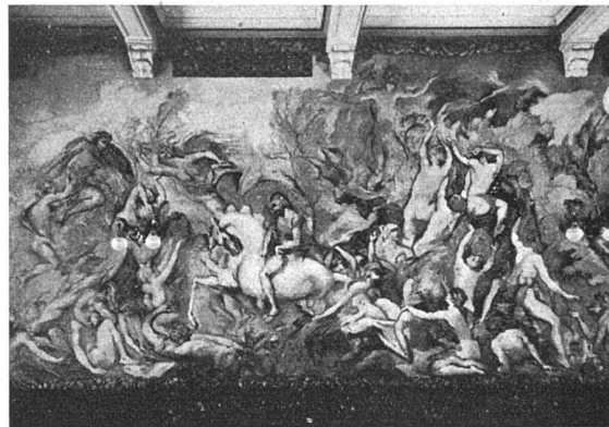
A. Soldenhoff, Teil des Wandbildes «Prometheus» Aula der Stadtschule Glarus

die verwaltungstechnische «Gleichschaltung» befohlen werden könnten.