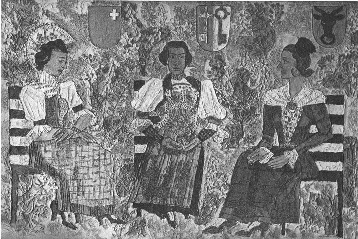
Erna Schillig, Altdorf (Kt. Uri) Putzmalerei 1,20 × 1,80 m