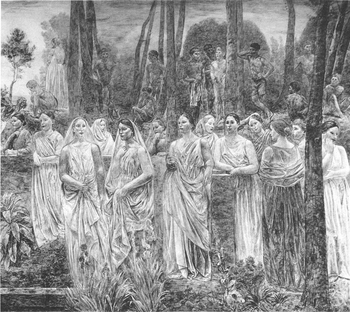
Wandgemälde (Fresko) von Paul Bodmer, Zürich, in der Aula der Universität Zürich, rechte Hälfte

im Interesse des Architekten, dessen Bedeutung in dem schönen, grosszügigen Lichthof der Universität bei weitem besser zur Geltung kommt.