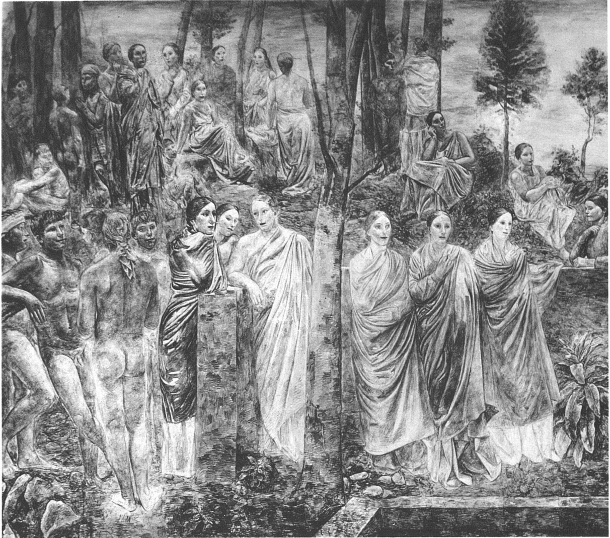
Wandgemälde (Fresko) von Paul Bodmer, Zürich, in der Aula der Universität Zürich, linke Hälfte

während Bodmers Akademie fast etwas Missionscharakter bekommt, den Anstrich einer gewagten Expedition akademischer Jünger und Jüngerinnen in partes paganorum, wo der Boden nur schlecht dafür vorbereitet ist. Hoffen wir, dass diese Mission verstanden werde und Wurzel fassen möge.