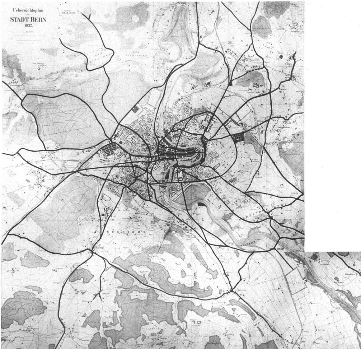
Bern, Verkehrslinienplan der Experten 1:60000, ausgearbeitet vom Preisgericht als Ergebnis der im Wettbewerb gemachten Vorschläge — Réseau des grandes communications, plan du jury

wenn es die Zahl der Brücken auf ein Minimum beschränken will, denn Brücken kosten Geld und besonders Hochbrücken. Um so wichtiger ist die genaue Festsetzung ihrer Lage. Auch braucht nicht jede Brücke 18 Meter breit zu sein, wenn 10 oder 8 Meter genügen. Um ein Beispiel zu nehmen: Welche Brücke ist wichtiger, diejenige vom Kirchenfeld nach dem Eichholz oder eine solche vom Eichholz nach der Elfenau, welche zudem die beiden grossen Vorortgemeinden Köniz und Muri unter sich verbindet und gleichzeitig eine flüssige Führung der Umgehungsstrasse von Freiburg—Murten nach Thun—Luzern und umgekehrt ermöglicht? Aber selbst wenn diese Um-