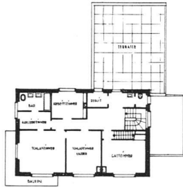
Obergeschossgrundriss 1:500 Erdgeschossgrundriss und Situation auf S. 193 unten

Baukosten ohne Terrain, jedoch mit Gartenanlage und Einfriedung rund Fr. 85,000 oder Fr. 72.— per Kubikmeter umbauten Raumes.