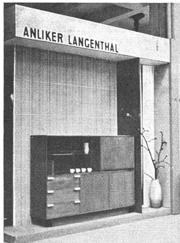
Stand einer Berner Firma. Eine der ganz wenigen Kojen mit sachlich-einfachen Möbeln an der diesjährigen Basler Mustermesse