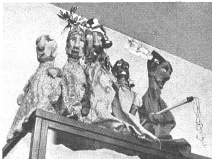
Holz-Marionetten, Bildhauer H. Würgler SWB, Bern