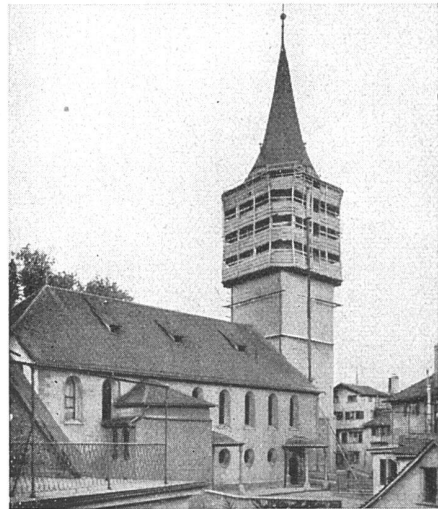
rechts: Kirche St. Peter Zürich

Vertreter in allen grösseren Kantonen • Mietweise Erstellung für Neu- und Umbauten durch