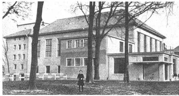
Der neue Fest- und Theatersaal der Kursaal Schänzli A.-G. Bern. Mitte November ist der Neubau eröffnet worden. Westseite. Architekt: Albert Gerster.

Der «Escalier Daru» ist vollkommen erneuert worden: die kleinliche Ornamentierung ist beseitigt, die Sammlung von Gipsabgüssen weggeräumt, so dass der ganze Raum nunmehr ohne Misston durch die grandiose Nike von Samothrake beherrscht wird. Auch die angrenzenden italienischen Säle sind erneuert, die Botticelli-Fresken aus der Villa Lemmi sind von der finstern Treppe in den hellen Saal der italienischen Primitiven versetzt worden, sie wie auch die Fragmente der Luini-Fresken sind in die Wand eingelassen, so dass sie nunmehr wandbildmässig wirken, wie sie gemeint sind, und nicht als Tafelbilder.