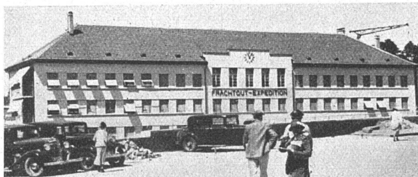
Der neue Güterbahnhof Weiermannshaus SBB