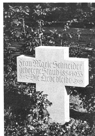
Grabsteine aus der Werkstatt für Grabmalkunst Max Pfänder, Bildhauer SWB, St. Gallen

für ein kleines Kind, das die Stimmung, in der es gestiftet ist, vollkommen rein ausspricht. Ist es nicht ein unnötiger und gefährlicher Bildungshochmut, wenn man von irgendeinem abstrakten Geschmacksideal aus derartiges als Geschmacklosigkeit anprangert — in dem sich gerade die letzten lebendigen Reste eines Volksgeschmacks und wirklich empfundener Symbolik aussprechen?