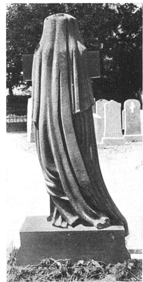
Die trauernde Witwe von hinten — und von vorn! Die Sucht, um jeden Preis originell zu sein, hat manchmal eine unfreiwillige Komik zur Folge, die hier nicht ganz am Platz ist