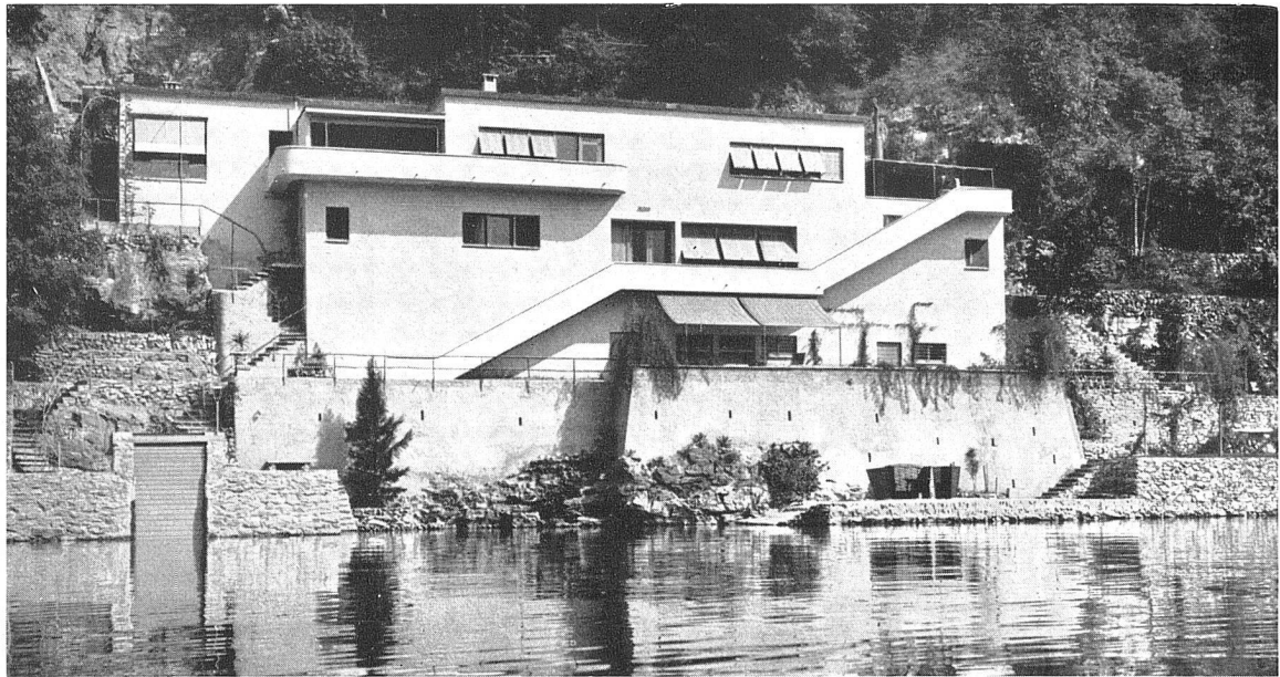
Haus Dr. H. in Ronco Arch. Karl Weidenmeyer, Ascona hiezü Obergeschossgrundriss 1:400, im Untergeschoss lediglich eine grosse Halle 10,65 x 6,4 m und rechts anschliessend ein Zimmer