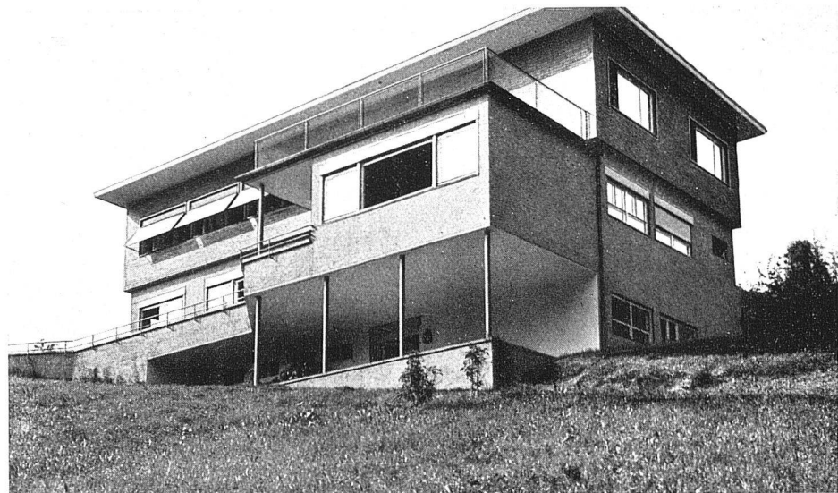
Ansicht aus Nordosten