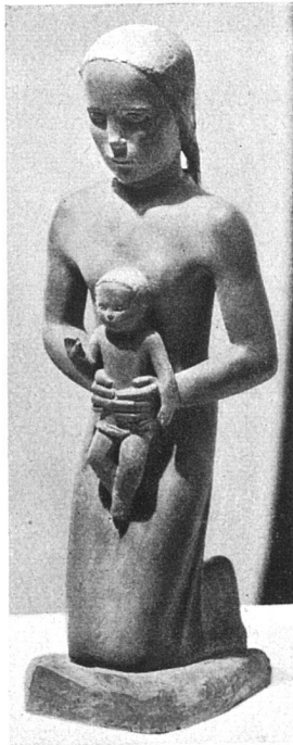
Vierge et enfant, bois Hans von Matt, Luzern