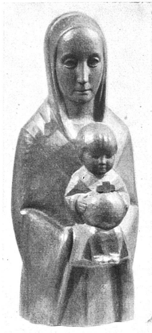
Vierge et enfant, bois Beat Gasser, Lungern