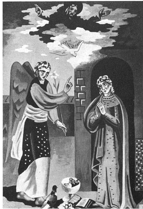
Annonciation, peinture murale Gino Severini