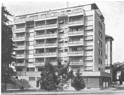
en haut: Immeubles Chemin de Roches, Genève M. Quétant, architecte en bas: Immeuble du quai des Arenières «Atelier d'Architectes»

Nous précisons également qu'en parlant d'une certaine carence des architectes du Palais, nous ne sortons pas du terrain esthétique et que les appréciations de