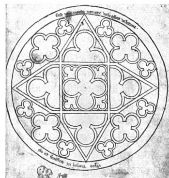
«cest une reonde ueriere de leglise de lozane» «ista est fenestra in losana ecclesia»

Die Rose im Querhaus der Kathedrale von Lausanne