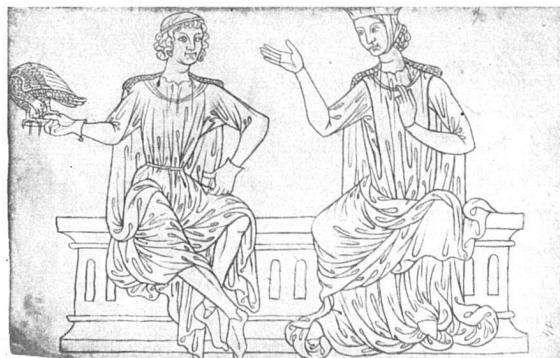
Aus dem Bauhüttenbuch des Villard de Honnecourt (stark verkleinert), oben höfische Szene, Gewänder im «Muldenstil», unten Figuren über geometrischer Grundfigur

Der neugewählte Professor für Kunstgeschichte an der Universität Bern legt uns einen schön ausgestatteten, nach Inhalt und Umfang gewichtigen Band mit den Ergebnissen mehrjähriger Forschung vor. Es handelt sich um eine Pergamenthandschrift aus dem XIII. Jahrhundert mit recht unübersichtlich zusammengestellten Zeichnungen, von denen 163 menschliche Figuren, Köpfe, Paare in verschiedener Grösse und Ausführung darstellen, 62 Tierbilder, darunter allerhand Fabelwesen, einige Architekturzeichnungen, bald flüchtig, bald sorgfältig gezeichnet, Risse für Kriegsmaschinen, Dachstühle, Sägemühlen, für ein Perpetuum mobile, ein Lesepult in Gestalt eines Adlers, der den Kopf bewegen kann, Figuren zur Geometrielehre, ein Rezept zur Beseitigung von Haaren und eines für einen Trank, der Wunden heilt. Als Verfasser nennt sich ein Villard de Honnecourt , von dem sich sonst noch keine Spur in Urkunden hat nachweisen lassen. Das einzigartige Manuskript ist schon länger bekannt und mehrfach herausgegeben. Hier aber sind seine Tafeln mit solcher Schärfe wiedergegeben, dass sogar Rasuren und die zarten Ritzungen des Zirkels auf dem Perga-