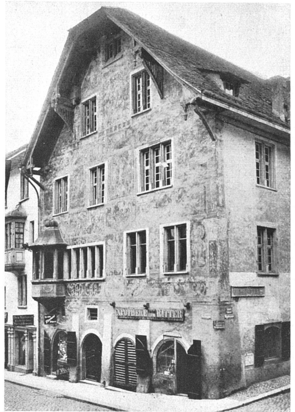
Zustand vor der Renovation von 1919 Der heutige Zustand ist noch wesentlich schlechter

Die Wandfüllungen von Henri Bischoff führen in das Grenzgebiet zwischen Tafelbild und Wandgemälde. Statt