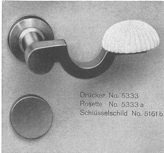
Drücker No. 5333 Rosette No. 5333 a Schlüsselschild No. 5161 b